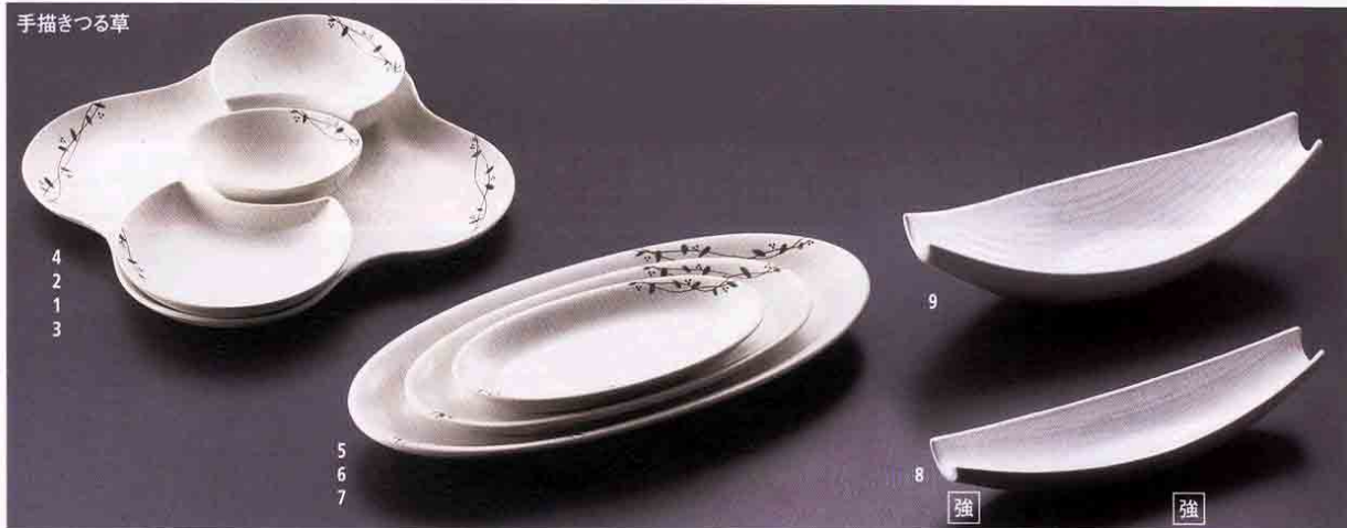
60304-21 2,500円 252160304 手描きつる草フィッシュトレイ (392×126×45mm)