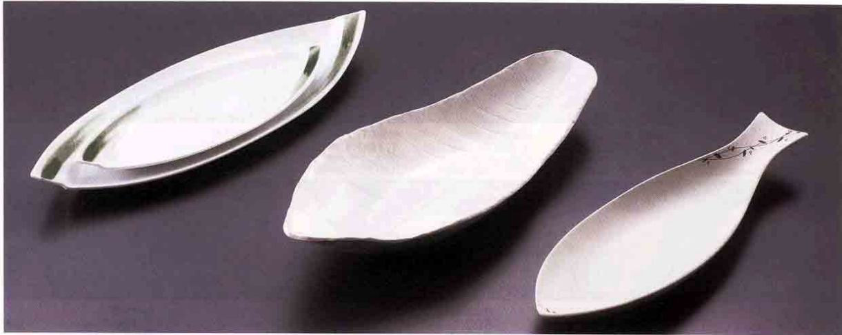
60301-05 1,400円 251956201 グリーン帯長皿(小) (325×120×30mm) 60302-05 3,850円 251956202 グリーン帯長皿(大) (440×165×40mm)