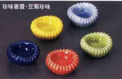
珍味箸置・豆菊珍味

09221-33 250円 253309221 青(45×45×20mm) 09222-33 250円 253309222 黄(45×45×20mm) 09223-08 250円 253089223 青磁(46×23mm) 09224-08 250円 253089224 オレンジ(46×23mm) 09225-08 250円 253089225 ヒワ(46×23mm)