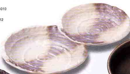
264-20-3Y 2,500円 2138264020 萩風10号変形丸皿(29.5φ×6H) 264-21-3Y 1,500円 2138264021 萩風8号変形丸皿(24.5φ×5H)