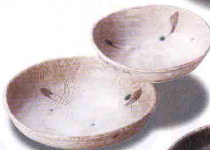
264-26-3Y 3,800円 2038225025 まりも10号盛鉢(30φ×8.5H) 264-27-3Y 1,800円 2038225026 まりも8号盛鉢(24φ×7H)