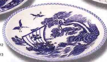
264-2-3Y 1,900円 1938211012 宝船丸皿12号(37φ×4H) 264-3-3Y 1,100円 1938211013 宝船丸皿10号(32φ×3H)