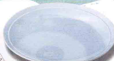
264-7-3Y 2,100円 青地高台皿12号(37.5φ×5H) 1938211014 264-8-3Y 1,900円 青地高台皿11号(34.5φ×5H) 1938211015 264-9-3Y 1,500円 青地高台皿10号(32φ×5H) 1938211016