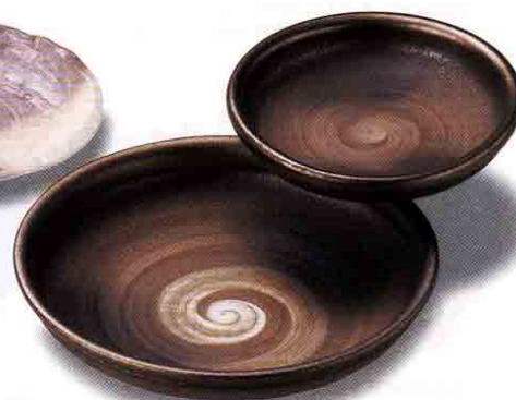
264-22-3Y 3,700円 2138264022 金彩10号メン鉢(29.5φ×6.5H) 264-23-3Y 1,700円 2138264023 金彩7号メン鉢(21φ×4.5H)