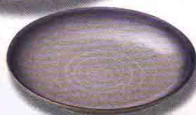
264-13-3Y 2,600円 2038249013 清流9号丸皿(28φ×4H) 264-14-3Y 1,700円 2038249014 清流8号丸皿(25φ×4H)