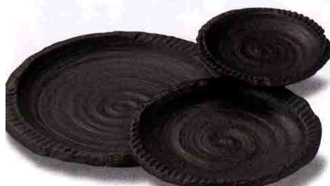
264-10-3Y 3,000円 黒いぶし彫刻皿(大)(34×32.5×3.5H) 2138264010 264-11-3Y 1,800円 黒いぶし彫刻皿(中)(26×24×3H) 2138264011 264-12-3Y 900円 黒いぶし彫刻皿(小)(19×18×2.5H) 2138264012