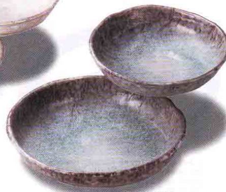
264-28-3Y 3,800円 2038225023 青釉10号盛鉢(30φ×8.5H) 264-29-3Y 1,800円 2038225024 青釉8号盛鉢(24φ×7H)