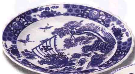
264-1-3Y 3,200円 1938211011 宝船雪輪皿13号(41φ×5.5H)