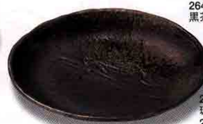
264-17-3Y 1,800円 1938215013 黒茶吹10号丸皿(31φ×4.2H)