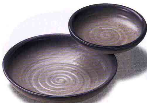
264-24-3Y 3,700円 1938211022 清流10号メン鉢(29.5φ×6.5H) 264-25-3Y 1,700円 2038249017 清流7号鉄鉢(21φ×4.5H)