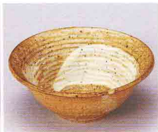
35-10-7E 1,200円 2174035010 黄河ハケ5.0鉢(15φ×6H)