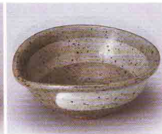
35-22-3B 1,200円 2132035022 土灰釉精円鉢(15.2×14×5.5H)