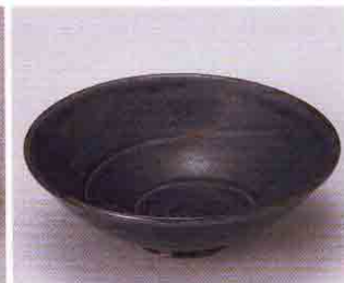
35-18-6A 1,250円 2161035018 手造青釉浅5.0平鉢(14.5φ×5H)