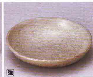
35-20-1A 1,250円 2111035020 雪之丞深口5.5皿(16.6φ×3.7H)