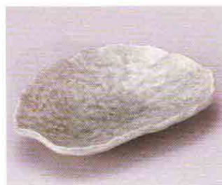
35-7-6A 1,300円 2161035007 ビードロ(砂目)三つ足向付(20.5×15×4H)