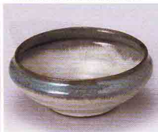
35-9-7F 1,300円 2075274015 手造り白唐津オリベ流変形鉢(14φ×5.8H)