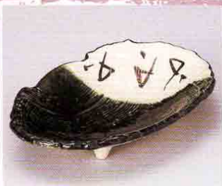
35-2-9C 1,360円 2193035002 織部くし目6.5小判皿(19.5×13×4H)