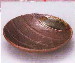
35-6-1B 1,360円 2012271031 信楽十草彫6.0鉢(18.3×17.8×4.3H)