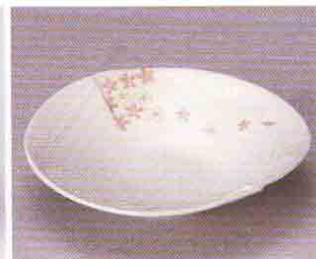
35-17-8F 1,200円 2185035017 NB桜6.0切合せ浅鉢(19×18×4.5H)