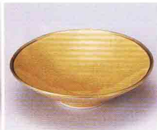
35-14-4S 1,400円 2149035014 (有田焼)四軸金黄平小鉢(15.5φ×4.5H)