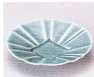
35-11-5E 1,400円 2154035011 深海青磁 平鉢(18.5φ×4H)