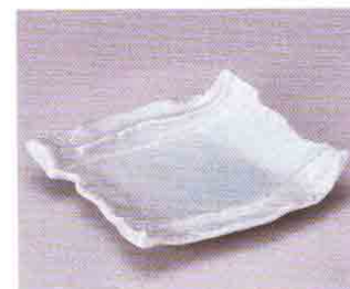
35-19-6F 1,200円 2165035019 青磁竹節6.0変形和皿(19×18.5×4H)