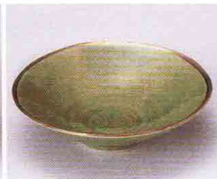
35-13-4S 1,400円 2149035013 (有田焼)四軸金緑平小鉢(15.5φ×4.5H)