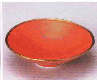
35-12-4S 1,400円 2149035012 (有田焼)四軸金赤平小鉢(15.5φ×4.5H)