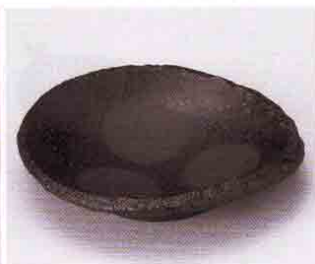
35-8-6F 1,300円 2165035008 炭化土丸向付(18.5×18.5×5H)