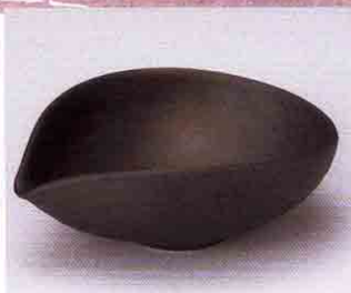
35-3-1B 1,800円 2112035003 備前風片口ボウル(大)(17×14×6H) 35-4-1B 1,200円 2112035004 備前風片口ボウル(中)(12.8×11.2×5.2H) 35-5-1B 530円 2112035005 備前風片口ボウル(ミニ)(10×8.8×4.4H)