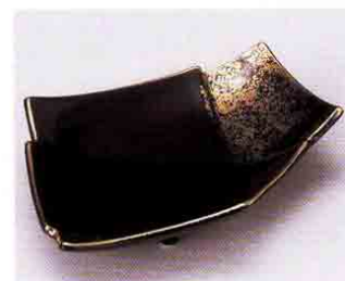
35-15-1B 1,490円 1912028015 金散し結び型足付向付(20.4×19.2×3.2H)