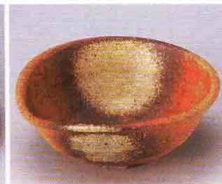
35-21-3B 1,200円 2132035021 伊賀火色精円鉢(15.2×14×5.5H)