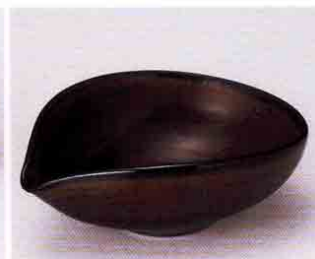
35-16-3B 1,280円 2132035016 うるし釉片口鉢(17×14×6H)