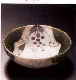
40-15-6B 2,750円 1962040016 織部ぶどう丸鉢 (14φ×4H)