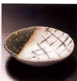
40-10-6B 2,970円 1962040006 織部格子丸皿 (14φ×3H)