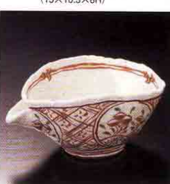
40-22-6F 2,400円 2185040022 線格子片口小鉢 (16×10.5×7.5H)