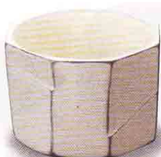
40-2-8F 3,800円 2185040002 粉引八角筒向付 (10φ×7H)