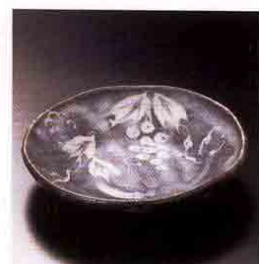
40-14-6B 2,760円 1962033005 帛ぶどう丸皿 (14φ×3H)