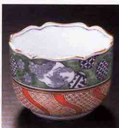
40-4-4S 3,600円 2149040004 (有田焼) 丸紋グリーン山水小鉢 (10.5φ×7H)