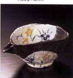
40-21-6F 2,400円 2185040021 魯山人写し片口小鉢 (16×10.5×7.2H)