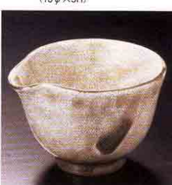
40-12-1C 2,800円 2113040012 かいらぎ変型小鉢 (11.5×12.8×6H)