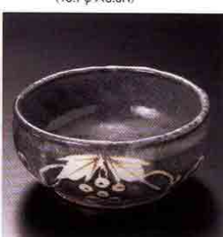
40-16-6B 2,700円 1962033010 帛志野ぶどう丸小鉢 (12.3φ×5.4H)