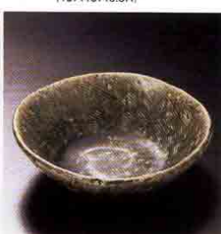
40-11-6B 2,800円 1962040008 織部くし目鉢 (13.7φ×3.5H)