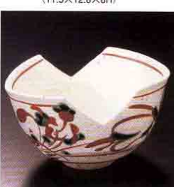
40-17-6F 2,700円 2065036011 赤絵花紋両切4.5鉢 (15×10.3×8H)