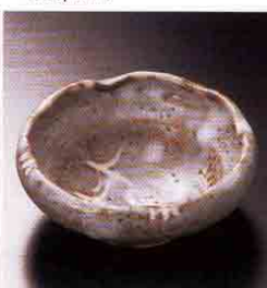
40-7-8F 3,200円 2185040007 ねずみ志野なぶり小鉢 (13φ×5H)