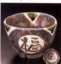
40-20-2C 2,500円 2123040020 帛志野織部(福) 涙切抹茶碗 (12×11.5×8H)