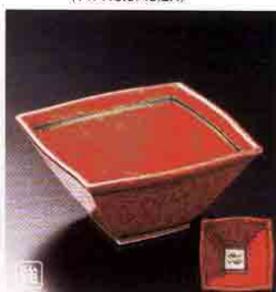
40-6-6F 3,200円 1965033003 赤絵双魚角小鉢 (13×13×6.3H)