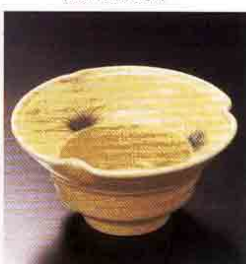
40-8-8F 3,200円 2185040008 黄瀬戸三つ押小鉢 (13φ×6.2H)