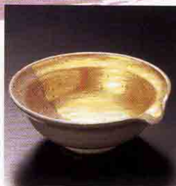
40-3-2F 3,750円 1925033002 荒土金彩片口小鉢 (14×13.6×5.2H)