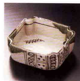
40-9-6A 3,000円 1961033006 手造織部4.5長角井 (12×10.5×5H)