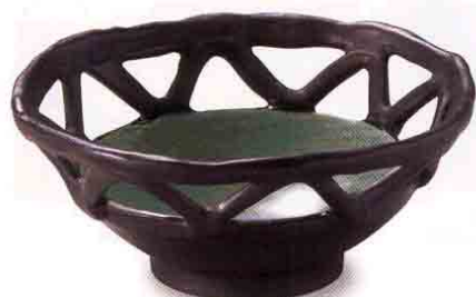
40-1-4S 4,100円 2149040001 (有田焼) 南蛮緑透し小鉢 (14φ×6H)