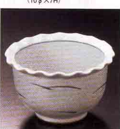
40-23-1B 2,390円 1912034001 銀彩武蔵野中鉢 (12.2φ×7.6H)