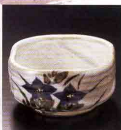
40-5-1B 3,600円 1912040013 乾山桔梗角小鉢 (12×10.8×5.6H)