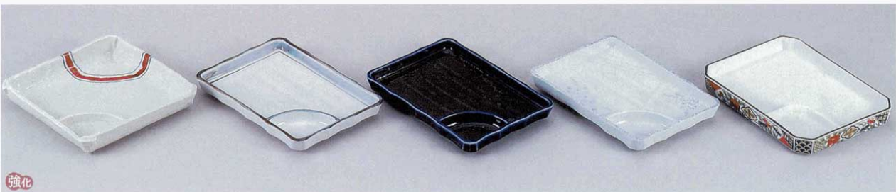
124-305-62 480円 淡墨波仕切皿 (14.5×11.5×3)