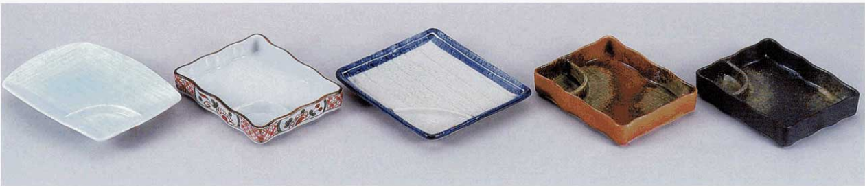
124-301-34 640円 青白磁仕切皿 (18×13.8×2.8)