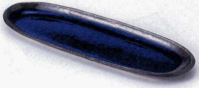
129-201-22 1,100円 銀河フェスタ皿 (34.3×11×1.8)