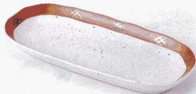
129-202-56 1,180円 赤帯さんま皿 (28.2×12.8×3)