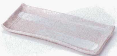
129-502-63 850円 志野備前9.0サンマ皿 (28×12×2)