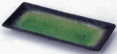
129-302-28 950円 有明さんま皿 (28.8×12.7×2.8)