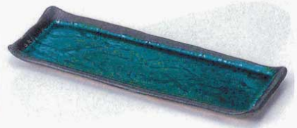
129-303-60 1,070円 海碧細長皿 (手造り) (29.5×10.5×2)