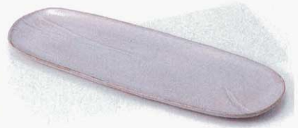
129-403-71 800円 うのふさんま皿 (33.6×11.8×2)