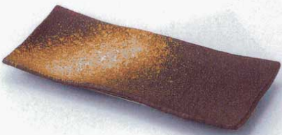
129-402-46 850円 黒備前さんま皿 (12.8×28×2.5)