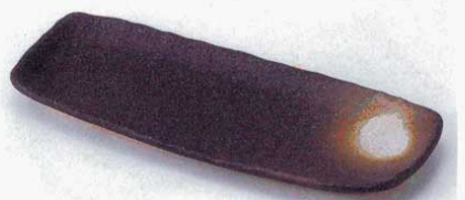
129-503-74 800円 黒備前さんま皿 (30×11.7×2.3)