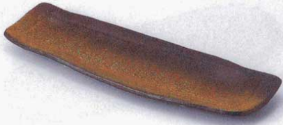
129-101-63 1,100円 黒備前四ツ足長皿 (33×10×3)