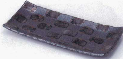
129-102-46 1,200円 黒市松サンマ皿 (28.5×7.3×2.8)