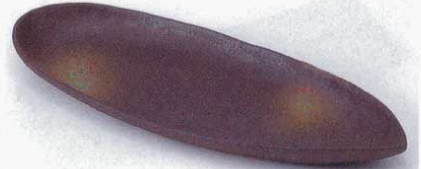
129-203-60 1,050円 うでいりフさんま皿 (33.8×12.7×3)