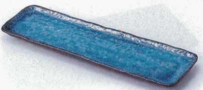
129-501-77 800円 オーシャントルコ特長皿 (32.8×9.5×2.2)