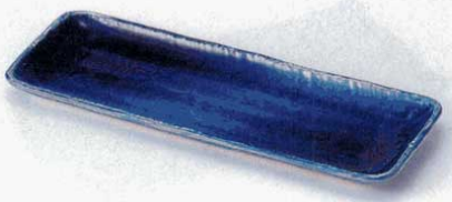
129-301-77 880円 藍流しさんま皿 (31.8×11×2)