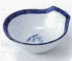
141-305-73 410円 桔梗香水 (12.5×4.9)