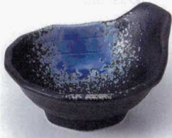
141-201-16 560円 いそべ香水 (13×11.5×5.8)