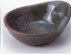
141-103-73 610円 南蛮織部香水 (13×10.5×4)