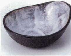
141-102-73 630円 備前志野香水 (12.8×10.6×3.5)