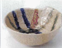
141-503-74 510円 黄瀬戸三彩香水 (12.8×12.3×5.3)