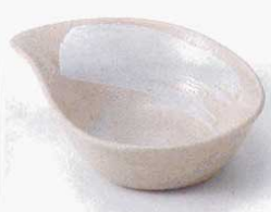
141-205-63 550円 志野備前変形香水 (14×10.5×4)