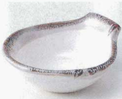
141-601-74 260円 ウノフ香水 (12.5×11.2×4.3)