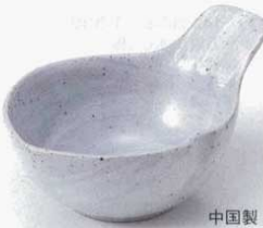
141-301-63 530円 粉引香水 (15.3×11.3×5)