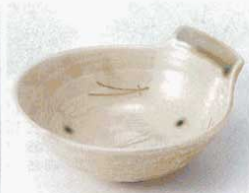
141-504-73 390円 キセト松葉香水(大) (14.5×5.4)