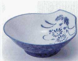
141-604-54 200円 淡雪菊香水 (13×12×4.5)