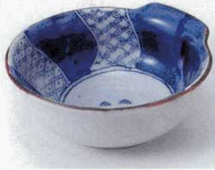
141-101-73 610円 ダミ七宝香水 (12.8×12×4.8)