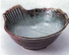
141-402-73 390円 ウノフグ香水 (12.7×12×5.3)