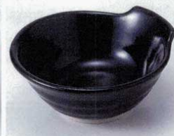
141-403-77 400円 天目香水 (12.5×12.1×5)