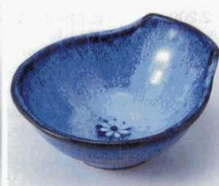
141-303-73 500円 青志野香水 (13.8×12.3×4.5)