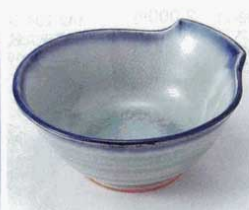
141-304-74 450円 御深井香水 (12.5×12×5)