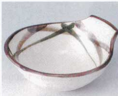
141-602-73 260円 貴入カゴメ香水 (12.5×11.5×4.3)