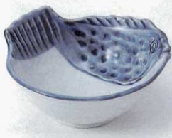
141-401-71 450円 古染ふぐ香水 (12.8×11.8×5.3)