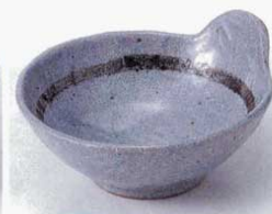
141-203-74 590円 単志野香水 (12×11.2×5.8)