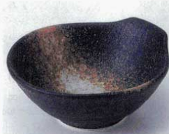
141-502-73 430円 黒備前香水 (12.8×12.3×5.3)