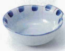
141-405-73 390円 測十草香水 (12.8×12.3×4.5)