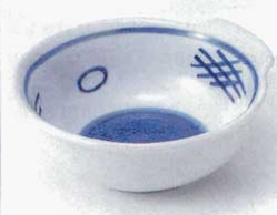
141-404-73 380円 カスリ香水 (12.8×12.3×4.5)