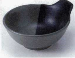
141-105-63 800円 夕霧香水 (14×12.4×5)