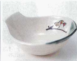
141-603-77 260円 梅香水 (12.6×11×4.3)