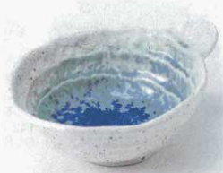
141-505-58 350円 水たまり手付香水 (15.3×12.2×5.5)