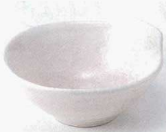
141-501-73 430円 桜志野香水 (12.8×12.3×5.3)