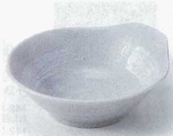
141-605-35 180円 グレー刷毛目香水 (13.2×12.5×4.2)