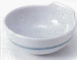
141-204-74 530円 雪小花香水(大) (13×12.8×5)