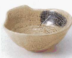
141-202-78 590円 黄瀬戸蘭香水 (12.8×12.4×5.5)