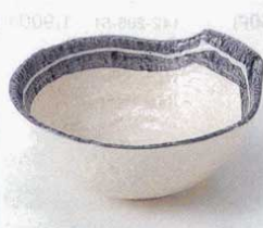
141-302-74 510円 測ライン香水 (12.8×12.3×5.3)