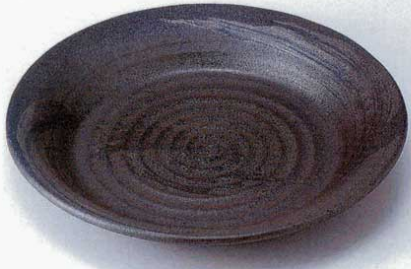
222-101-92 6,000円 11.0黒彩大鉢(33×33×5)