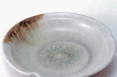
222-401-25 5,600円 伊賀渦三ツ押10.0鉢(φ29.7×5.0)