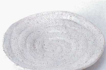
222-301-27 5,200円 白軸木目形入四ツ足11.0丸皿(33×5)