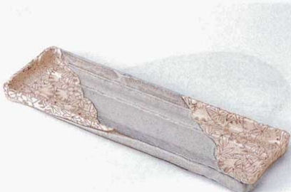
222-201-5 5,900円 京春秋長角皿(45×13.5×2.5)