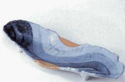
222-402-35 5,300円 金彩呉須櫛目長皿(42.8×14.5×5.5)