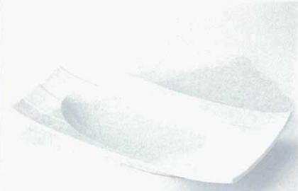
強化 222-203-63 5,700円 料亭けずり12.0楕円長皿(白)(37×18×5.8)