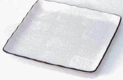
222-102-31 5,580円 測錆白刷毛正角オードブル(31×31×2.8)