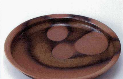
222-403-51 6,000円 備前10.0皿(31.8×4.7)