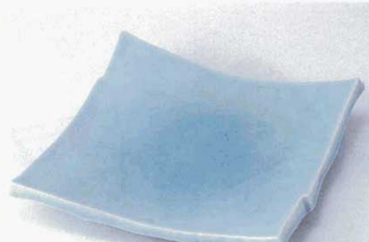
222-202-34 5,800円 青白磁井桁10.0正角盛皿(30×30×5.7)