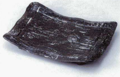
222-103-32 5,900円 炭化土白化粧12.0盛込皿(37×26.2×5)