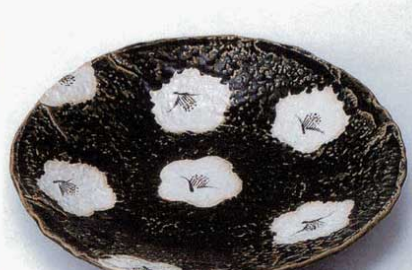
222-302-5 5,500円 織部椿盛皿(32.8×4.5)