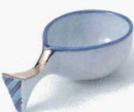
75-602-74 780円 ルリ金彩珍味(10×5.5×3)