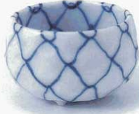
75-103-10 950円 アミ三ツ足珍味(4.2×3)