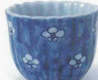
75-204-10 940円 梅濃小付(6×4.8)