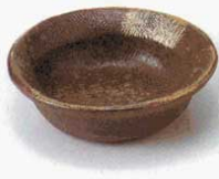
75-506-74 820円 金彩吹織部淵付珍味(8×2)