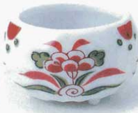
75-104-2 700円 草花三ツ足珍味(4.3×2.9) 50入