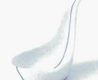
75-404-35 930円 呉須ラインレンゲ珍味(10×6.3)