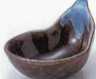
75-606-32 770円 色釉ナス珍味入(7.5×6.5×3)