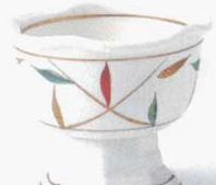
強化 75-301-73 1,000円 金彩芦高台珍味(6.3×5.7)