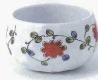
75-105-2 700円 唐草花三ツ足珍味(小)(4.3×2.9) 50入