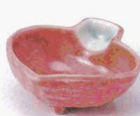
75-605-32 770円 色釉カブ珍味入(7.3×6.5×3)