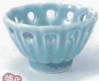
強化 75-503-30 930円 深海青磁透し珍味(7.2×4.5)