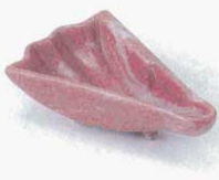
75-401-2 1,000円 赤染扇珍味(6.5×11×2.5)