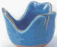
強化 75-201-78 890円 トルコ割山椒珍味(6.6×4.4)