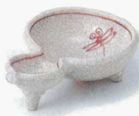
75-402-2 1,000円 とんぼひざご型珍味(9.2×7.2×2.7)