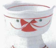
強化 75-302-73 690円 赤絵小花高台珍味(6.3×5.7)