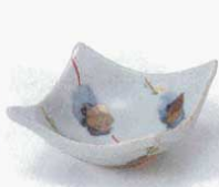
75-306-60 1,050円 春香四方珍味(7.4×7.4×3.2)