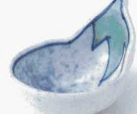
75-604-32 770円 染付ナス珍味入(7.5×6.5×3)