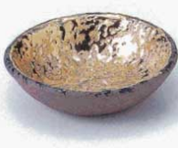
75-502-77 910円 内金丸珍味(8.5×2.5)