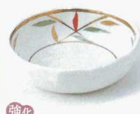
強化 75-505-73 860円 金彩芦丸千代口(7.7×2.1)