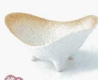
強化 75-405-73 820円 黄吹ラスターニツ切珍味(8×7×3.7)