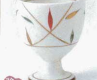
強化 75-106-73 860円 金彩芦ワインカップ(4.8×6.1)