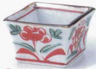
強化 75-102-77 1,350円 赤絵角珍味(4.8×3.3)