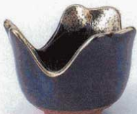
強化 75-202-78 890円 高砂割山椒珍味(6.6×4.4)