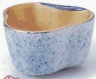
強化 75-101-71 1,350円 金彩松型珍味(5×4.5×2.8)