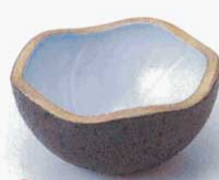
強化 75-205-77 1,020円 外結晶釉梅型珍味(ブルー)(6.5×3.3)