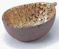
75-501-77 910円 内金ナズ珍味(9×6.3×3.2)