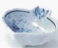
75-603-32 770円 染付カブ珍味入(7.5×6.5×3)