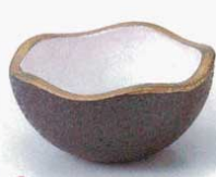
強化 75-206-77 1,020円 外結晶釉梅型珍味(ピンク)(6.5×3.3)