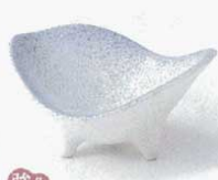
強化 75-406-73 820円 ブルー吹ラスターニツ切珍味(8×7×3.7)