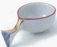
75-601-74 780円 朱金彩珍味(10×5.5×3)