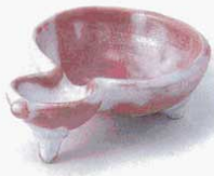
75-403-2 1,000円 赤染ひざご型珍味(9.2×7.2×2.7)