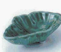
75-304-34 1,150円 緑交趾葉型珍味(10.2×6.3×3)