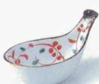
強化 75-303-78 1,350円 赤絵ひざご型珍味(4×4×2.3)