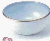
強化 75-504-78 910円 刷金ブルー丸珍味(7.2×3.3)