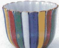
75-203-10 1,000円 色十草小付(6×4.8)