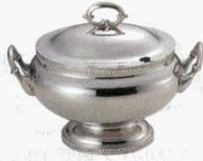
① スープチューリン 小判型 菊測 18-8 SW 大 (4ℓ) (1507400) 小 (2.6ℓ) (1507500)