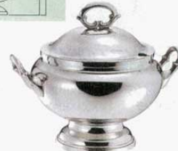
⑦ スープチューリン 丸型 平測 18-8 SW 大 (3.2ℓ) (1508000) 小 (2ℓ) (1508100)