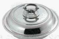
⑱ エントレーディッシュ 丸型 菊測 18-8 UK 10インチ (1511400) 外寸：φ255×H130mm