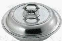
⑰ エントレーディッシュ 丸型 B測 18-8 UK 10インチ (1511300) 外寸：φ255×H130mm