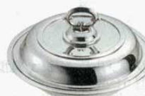
⑲ エントレーディッシュ 丸型 平測 18-8 SW 外寸：φ250×H132mm (1511500) ※B測 (1511600)、菊測 (1511700)、 モンテリー測 (1511800) もあります。