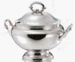
⑧ スープチューリン 丸型 モンテリー 18-8 SW 大 (3.2ℓ) (1508400) 小 (2ℓ) (1508500)