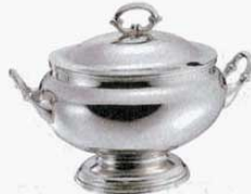
② スープチューリン 小判型 B測 18-8 SW 大 (4ℓ) (1507600) 小 (2.6ℓ) (1507700)