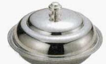
⑯ エントレーディッシュ 丸型 パロン 18-8 UK 9インチ (1513900) 外寸：φ230×H100mm 1,200cc