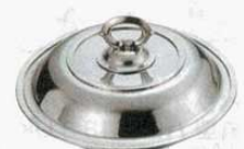
⑳ エントレーディッシュ 丸型 18-8 AH 大 外寸：φ240×H130mm (1511900) 小 外寸：φ200×H130mm (1512000)