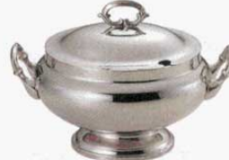
③ スープチューリン 小判型 平測 18-8 SW 大 (4ℓ) (1507000) 小 (2.6ℓ) (1507100)