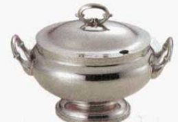
④ スープチューリン 小判型 モンテリー 18-8 SW 大 (4ℓ) (1507200) 小 (2.6ℓ) (1507300)