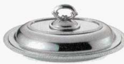
⑭ エントレーディッシュ 小判型 菊測 18-8 SW 外寸：298×216×H123mm (1512500) ※モンテリー測もあります。 (1512400)