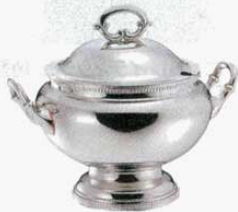
⑤ スープチューリン 丸型 菊測 18-8 SW 大 (3.2ℓ) (1508200) 小 (2ℓ) (1508300)