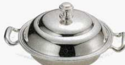
⑮ エントレーディッシュ 手付 丸型 パロン 18-8 UK 6インチ 外寸：φ145×H 90mm (1513400) 7インチ 外寸：φ170×H105mm (1513500) 8インチ 外寸：φ195×H130mm (1513600)