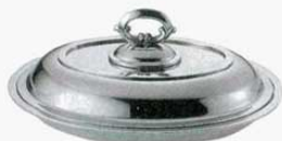
⑬ エントレーディッシュ 小判型 平測 18-8 SW 外寸：287×204×H123mm (1512300) ※B測もあります。(1512600)