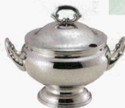
⑥ スープチューリン 丸型 B測 18-8 SW 大 (3.2ℓ) (1507800) 小 (2ℓ) (1507900)