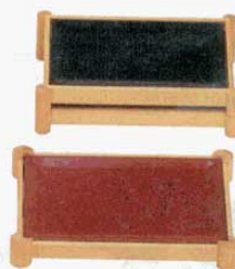
⑦ 盛台 高級プレート ひのき 黒 朱 TSK-52 520×365×H75mm (3251410) (3251420) TSK-46 460×330×H65mm (3251510) (3251520) TSK-41 410×315×H55mm (3251610) (3251620) TSK-38 380×280×H50mm (3251710) (3251720) TSK-33 330×215×H50mm (3251810) (3251820) ※ご注文の際は黒又は朱をご指定下さい。