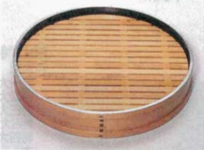
⑬ 盛皿 TS-400 丸型 外寸 φ390×H60mm (4412700) 材質：杉 ※すのこを取りはずしても使用できます。