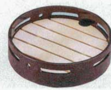
⑮ 盛皿 (目皿別) 5寸布目すかし φ158×H47mm (8084300) 材質：ABS樹脂