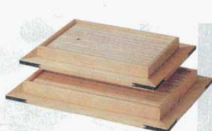
⑨ 盛皿 歌舞伎 大 外寸 630×460×H90mm (6730400) 小 外寸 540×400×H90mm (6730500) ※3パターンでの盛付が可能です。