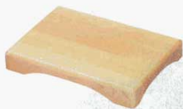
① 盛台 新型 ひのき EBM T-46 (1人用小) 180×120mm (4414600)