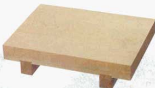
② 盛台 無地 ひのき 5人用 450×270×H90mm (1574400) 4人用 360×240×H85mm (1574500) 3人用 300×220×H75mm (1574600) 大(2人用) 240×180×H57mm (1574700) 中(1人用) 210×135×H55mm (1574800) 小(1人用) 210×105×H40mm (1574900)