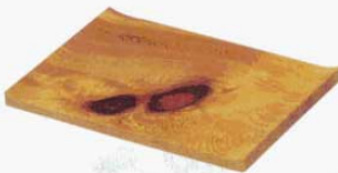
⑥ 盛皿 無地 ひのき 特大 210×300×H30mm (1576300) 大 180×270×H30mm (1576400) 中 150×240×H30mm (1576500) ミニ 105×180×H30mm (1576700)