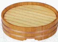
⑭ 丸桶盛皿器 (目皿付) 尺2木製 外寸 φ365×H80mm (8084600)