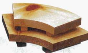
③ 盛台 紅節 末広 ひのき 大 350×180×H58mm (3255400) 小 260×150×H58mm (3255500)