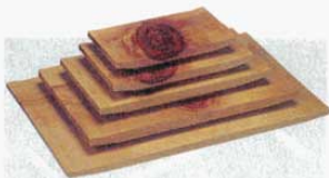
⑤ 盛皿 紅節 ひのき R5 450×300×H30mm (3254600) R2 360×240×H30mm (3254700) R 300×180×H30mm (3254800) 9寸 270×180×H30mm (3254900) 8寸(大) 240×150×H30mm (3255000) 8寸(小) 240×120×H30mm (3255100) 7寸(大) 210×150×H30mm (3255200) 7寸(小) 210×120×H30mm (3255300)