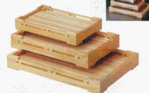
⑧ 盛台 雲流型 絵付板 ひのき 特大 外寸 520×370×H67mm (1574000) 大 外寸 445×295×H67mm (1574100) 中 外寸 360×240×H60mm (1574200) ※裏面は、内朱仕上げになっており、両面ご使用できます。