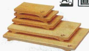
④ 盛台 雲流型 絵付板 ひのき R5 450×300×H30mm (3252700) R2 360×240×H30mm (3252800) 9寸 270×180×H30mm (3252900) 8寸 240×150×H30mm (3253000) 7寸(大) 210×150×H30mm (3253100) 7寸(小) 210×120×H30mm (3253200)