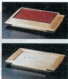
⑩ 盛皿 舟型 ひのき 特大 外寸 635×370×H100mm (3254200) 大 外寸 500×350×H 80mm (3254300) 中 外寸 438×320×H 70mm (3254400) 小 外寸 370×265×H 70mm (3254500)