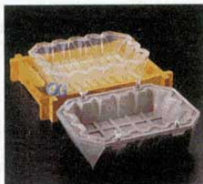
① 製氷器 M10-908 氷山 アルミ (1610800) 300×420×H100mm (出来上がり外寸) ※置台は別売です。⑤M40-421 をご使用下さい。

パンケット・ソービスワゴン パンケット用品 ウォンケット 卓上器物洋 料理演用品 和 ダストボックス キッチン洗浄 清掃用品 カトラリー キャンプロシリーズ