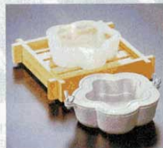
⑦ 製氷器 M10-911 梅 (1人用) アルミ φ150×H45mm (1611400) ※寸法は出来上がり寸法です。 ※置台は別売です。 ①M40-423、または ②M40-422をご使用下さい。