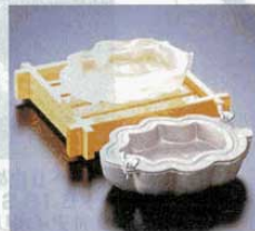
⑧ 製氷器 M10-910 木の葉 (1人用) アルミ 155×210×H50mm (1611500) ※寸法は出来上がり寸法です。 ※置台は別売です。 ①M40-423、または ②M40-422をご使用下さい。