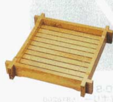
⑥ 製氷器用置台 M40-420 菊・梅用 木製 外寸: 455×455×H85mm (1611300) スノコ: 350×350mm