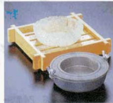
⑩ 製氷器 M10-912 丸型 (1人用) アルミ φ155×H50mm (4414700) ※寸法は出来上がり寸法です。 ※置台は別売です。 ①M40-423、または ②M40-422をご使用下さい。