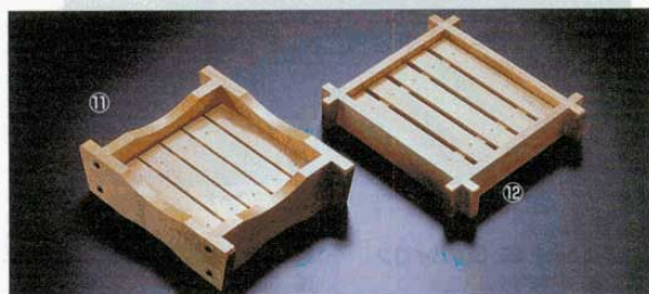
⑪ 製氷器用置台 (1人用) 木製 M40-423 (1611700) 外寸: 210×260×H75mm スノコ: 175×175mm ⑫ 製氷器用置台 (1人用) 木製 M40-422 (1608900) 外寸: 245×260×H55mm スノコ: 180×200mm