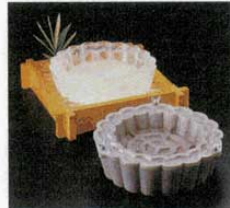
④ 製氷器 M10-905 菊 アルミ (1611100) φ370×H90mm (出来上がり外寸) ※置台は別売です。⑥M40-420 をご使用下さい。