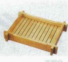
⑤ 製氷器用置台 M40-421 氷山・舟用 木製 外寸: 400×515×H85mm (1611200) スノコ: 295×410mm