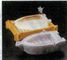
③ 製氷器 M10-906 舟 アルミ (1611000) 460×250×H90mm (出来上がり外寸) ※置台は別売です。⑤M40-421 をご使用下さい。