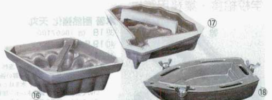
⑬ 製氷器 菱形 アルミ製 270×205×H60mm (出来上がり水外寸) (3805200)