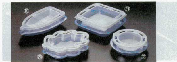
氷鉢 家庭用 ⑯舟型 126×259×H54mm (出来上がり水外寸) (1612600)