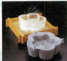
② 製氷器 M10-907 梅 アルミ (1610900) φ300×H90mm (出来上がり外寸) ※置台は別売です。⑥M40-420 をご使用下さい。