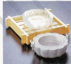
⑨ 製氷器 M10-909 菊 (1人用) アルミ φ160×H50mm (1611600) ※寸法は出来上がり寸法です。 ※置台は別売です。 ①M40-423、または ②M40-422をご使用下さい。