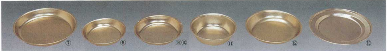
酸化アルマイト食器 ⑦ 108-A パン皿 (深型) φ180×H20mm (8089800) ⑪ 109-B 小物食器 φ135×H35mm (8090200) ⑧ 109 小皿 φ120×H20mm (8089900) ⑫ 104 パン皿 (深型) φ160×H20mm (8090300) ⑨ 109-D 中皿 φ145×H23mm (8090000) ⑬ 105 パン皿 (浅型) φ180×H13mm (8090400) ⑩ 109-A 中皿 φ150×H20mm (8090100)