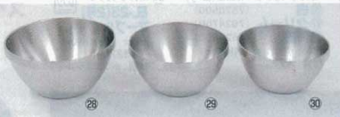
給食用汁椀 (スープボール) 18-8 ㉔ L φ136×H66mm 使用容量450cc 満水500cc 164g (7624900) ㉕ ㉕ M φ125×H60mm 使用容量360cc 満水400cc 135g (7625000) ㉖ ㉖ S φ115×H57mm 使用容量300cc 満水330cc 126g (7625100) ㉗