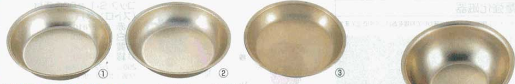
① 特深皿 106 アルマイト φ160×35mm (5445400) ② 深皿 107 特大 アルマイト φ180×35mm (5445500) ③ 給食皿 108 ジャンボ アルマイト φ215×30mm (5445600)

和・洋・中 給食・食器 パンケツト用品 パンケツト ウオーマー 卓上器物 洋 料理演出用品 和 鍋物用品 和・洋・中 喫茶サービス用品 ガラス・ワイン・ ハイ用品 卓上小物 石焼ヒビンバ