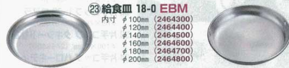
⑳ 給食皿 18-0 EBM 内寸 φ100mm (2464300) φ120mm (2464400) φ140mm (2464500) φ160mm (2464600) φ180mm (2464700) φ200mm (2464800)