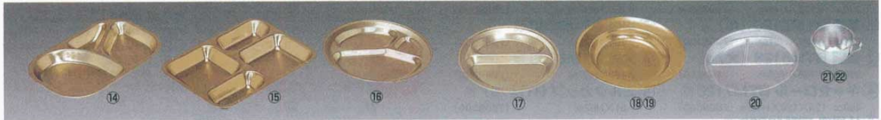
⑭ 115 ランチ皿長方形 (3食) 305×200×H24mm (8090500) ⑲ 117-B カレー皿 φ240×H30mm (8091410) ⑮ 116 ランチ皿長方形 (4食) 310×220×H30mm (8090600) 20 114 -A ランチ皿丸型 (3食) φ190×H20mm (8090800) ⑯ 114 ランチ皿丸型 (3食) φ240×H20mm (8090700) 21 119 手付コップ (8cm) 200cc φ80×H50mm (8090900) ⑰ 113 ランチ皿丸型 (2食) φ210×H20mm (8091300) 22 120 手付コップ (9cm) 300cc φ90×H56mm (8091200) ⑱ 117-A カレー皿 φ220×H30mm (8091400) ※20~22はシルバーアルマイトです。