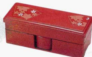
⑲やしろ弁当 2段(汁鉢付) 春秋 外寸: 340×140×H138mm (3486100) 材質: ABS樹脂

※このページの商品は、メーカー直送になります。ご注文の際は、納期・在庫の確認をお願いします。