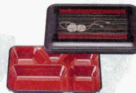
⑫長手副食弁当 パール鈴内朱 小 T-183 洗 8寸 外寸: 231×172×H49mm (1212400) 材質: 耐熱ABS樹脂