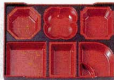
③長手松花堂用 D.X懐石仕切 朱天黒 R3寸 外寸: 358×241×H40mm (1203120) 材質: ABS樹脂