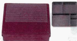
⑨ニュー角固定弁当 マルーン 8寸 外寸: 242×242×H63mm (1207900) 材質: ABS樹脂