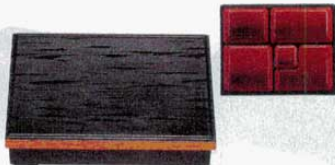
⑩ヘギ目松花堂 黒淵朱(D.X仕切付) 9寸 外寸: 272×211×H60mm (1206610) 材質: ABS樹脂