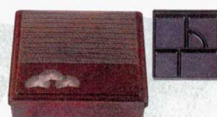
⑧角別仕切千筋弁当 梨地松葉(仕切付) 8寸 外寸: 245×245×H60mm (1207800) 材質: ABS樹脂