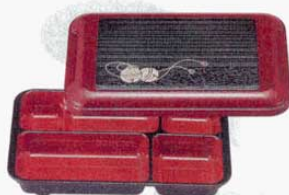
⑬長手副食弁当 パール鈴内朱 小 T-190 洗 9寸 外寸: 267×175×H51mm (1212500) 材質: 耐熱ABS樹脂