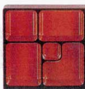
⑦角弁当用 D.X仕切 朱天黒 8寸 (1206910) 材質: ABS樹脂 ⑥⑧⑨の弁当に合います。