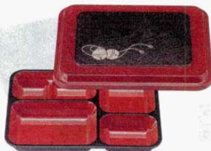
⑭長手副食弁当 パール鈴内朱 大 T-182 洗 9寸 外寸: 270×210×H54mm (1212600) 材質: 耐熱ABS樹脂

⑫～⑭ 耐熱ABS樹脂の特長 ●耐熱温度/80℃～110℃ (原料のグレードにより異なります。) ●衝撃に強いので割れにくく、耐久性に 優れ塗料の密着も良好です。 ※食器洗浄機に使用できます。