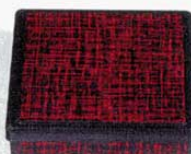
⑪角弁当 朱布目 7寸 外寸: 210×210×H55mm (1207700) 材質: ABS樹脂