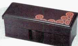
⑱やしろ弁当 2段(汁鉢付) 蛇の目 洗 外寸: 340×140×H138mm (3486200) 材質: ABS樹脂