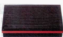
①若手千筋松花堂 黒淵朱 R3寸(仕切別) 外寸: 380×263×H65mm (1203100) 材質: ABS樹脂 仕切は、②③よりお選び下さい。