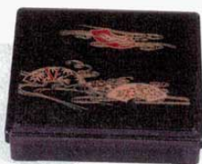
⑥角弁当 D.X茶パール扇面(仕切別) 8寸 外寸: 245×245×H60mm (1206900) 材質: ABS樹脂