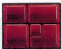
⑤長手三里弁当用仕切 朱天黒 9寸 外寸: 255×197×H38mm (1203210) 材質: ABS樹脂