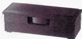
⑰神楽弁当 2段(汁鉢付) 黒内朱 洗 (5024000) 外寸: 375×138×H115mm 材質: ABS樹脂