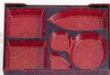
②若手千筋松花堂用 D.X仕切 朱天黒 R3寸 外寸: 360×242×H39mm (1203110) 材質: ABS樹脂