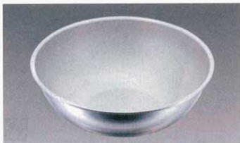
① ボール IKD抗菌フッ素加工 材質: 内側/フッ素樹脂加工 (パールグリーン) 外側/18-8ステンレス