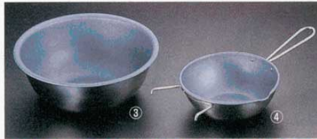
③ ミキシングボール ベイクウェア ④ 湯煎ボール ベイクウェア

深さ 容量 27cm H208mm (9ℓ) (2538000) 30cm H212mm (12ℓ) (2538100) 36cm H260mm (20ℓ) (2538200) 丸型の底なので、泡立てや混ぜる動きがスムーズです。