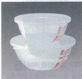
⑪ 目盛り付ボウル2点セット (蓋付)

容量 外径 15cm (1.2ℓ) φ195mm×H 85mm (3586500) 18cm (1.8ℓ) φ225mm×H 95mm (3586600) 21cm (3.0ℓ) φ250mm×H110mm (3586700) 24cm (4.5ℓ) φ285mm×H130mm (3586800)