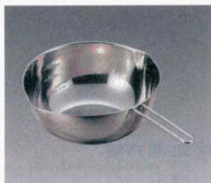
⑨ 手付ボール 口付目盛付 18-8

大 (2.4ℓ) 内寸: φ210×H93mm (0400200) (目盛/500cc・1,000cc・1,500cc) 中 (1.6ℓ) 内寸: φ176×H88mm (0400300) (目盛/300cc・600cc・1,000cc) 小 (1ℓ) 内寸: φ150×H82mm (0400400) (目盛/200cc・400cc・600cc)