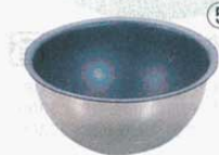
⑤ ボール 深型 泡立用 ブラックフィギュア

深さ 容量 18cm H 95mm (1.8ℓ) (3600400) 21cm H110mm (2.8ℓ) (3600500) 24cm H130mm (4.5ℓ) (3600600) ※シルバーストーン加工 (外 ステンレス)