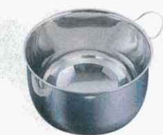
② 泡立ポズ 18-8 クローバー

深さ 容量 18cm H 95mm (1.8ℓ) (3600400) 21cm H110mm (2.8ℓ) (3600500) 24cm H130mm (4.5ℓ) (3600600) ※シルバーストーン加工 (外 ステンレス)