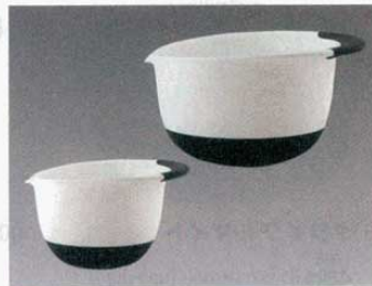
⑫ オクノ ミキシングボウル

(1096900) 中 φ210×H100mm 大 φ240×H100mm 材質: ポリプロピレン ※フタをそのまま電子レンジにかけられます。