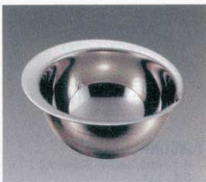
⑩ フランジャーボール 口付目盛付 18-8

容量 外径 15cm (0.85ℓ) φ160×H60mm (3586200) 18cm (1.55ℓ) φ190×H75mm (3586300) 21cm (2.2ℓ) φ220×H85mm (3586400)