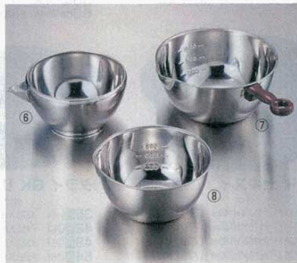
⑥ ボール 片口 18-8

内寸 大 (1.4ℓ) φ152×H89mm (0399600) 中 (0.9ℓ) φ140×H77mm (0399700) 小 (0.7ℓ) φ124×H75mm (0399800)