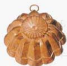
⑱ 403 105×105×H42mm (2768300)