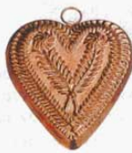
㉞ 707 140×124×H15mm (2767400)