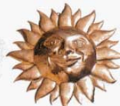
⑤ 1003 260×258×H35mm (2765300)