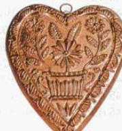
㊱ 709 245×200×H18mm (2767600)