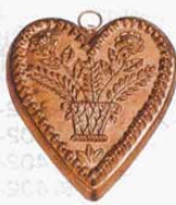
㉟ 708 173×146×H19mm (2767500)