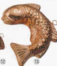
⑬ 602 A315×B260×H53mm (2766200)