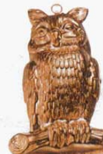
⑩ 1224 285×180×H56mm (2765900)