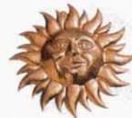
④ 1002 170×168×H24mm (2765200)