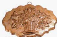
① 1228 285×378×H48mm (2765000)