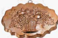
② 1229 285×387×H52mm (2765100)