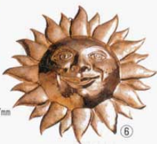
⑥ 1004 355×353×H57mm (2765400)