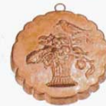
⑰ 1227 190×190×H39mm (2768200)