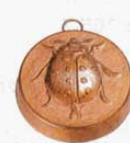
㉛ 1216 85×85×H25mm (2771900)