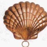
㊲ 510 130×135×H33mm (2767700)