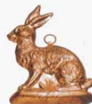
⑧ 1210 128×90×H14mm (2765700)