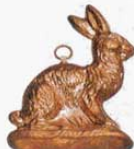
⑦ 1211 130×94×H15mm (2765600)