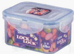
④ 密閉容器 L&L スナックキーパー HPL807 (1890300) 容量：470ml サイズ：135×102×H68mm