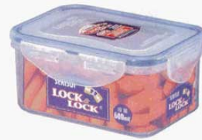
③ 密閉容器 L&L スナックキーパー HPL811 (1890400) 容量：600ml サイズ：151×108×H69mm