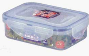
⑤ 密閉容器 L&L スナックキーパー HPL810 (1890200) 容量：360ml サイズ：151×108×H45mm