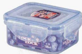
⑦ 密閉容器 L&L スナックキーパー HPL805 (1890000) 容量：180ml サイズ：108×88×H48mm