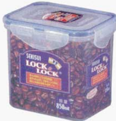
② 密閉容器 L&L スナックキーパー HPL808 (1890500) 容量：850ml サイズ：135×102×H118mm