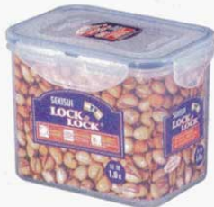
① 密閉容器 L&L スナックキーパー HPL812 (1890600) 容量：1,000ml サイズ：151×108×H117mm

小さな食品から小分けに保存したものまで、食べ物の種類によって便利に使えるサイズが揃っています。