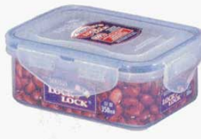
⑥ 密閉容器 L&L スナックキーパー HPL806 (1890100) 容量：350ml サイズ：135×102×H52mm