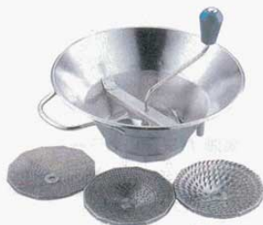
⑧ ムーラン 18-10 LT 31cm (A310 B140 C130mm) (8400200) ※1.5mm、2.5mm、4.0mmの替刃3枚付 ※丈夫なステンレスタイプ