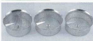
⑤ ムーラン 37cm用替網 18-10 LT X5010 1mm目 (8400400) X5015 1.5mm目 (8400500) X5020 2mm目 (8400600) X5030 3mm目 (8400700) X5040 4mm目 (8400800)