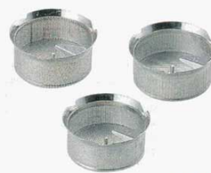
⑦ ムーラン 37cm用替網 スズメッキ LT M5010 1mm目 (0458800) M5012 1.5mm目 (0458900) M5020 2mm目 (0459000) M5030 3mm目 (0459100) M5040 4mm目 (0459200)