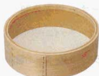
⑫ 粉フルイ(木枠) 真鍮張 (24メッシュ) 外寸 8寸(24cm) φ240×H75mm (3075600) 9寸(27cm) φ270×H90mm (3075700) R (30cm) φ300×H90mm (3075800) R1(33cm) φ330×H90mm (3075900) R2(36cm) φ355×H95mm (3076000)