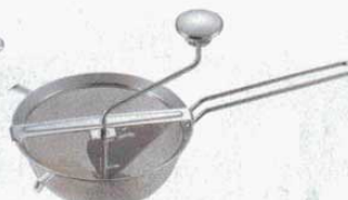
② ストレーナープレス 24500 ボール型 INOX Gefu (7271900) ボール：内径 190mm 高さ 90mm 全長 375mm 全高 200mm