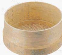
⑭ そぼろふるい(木枠) 籐製 6寸 φ253mm×H110mm 細目 約2.0mm目 (6849700)