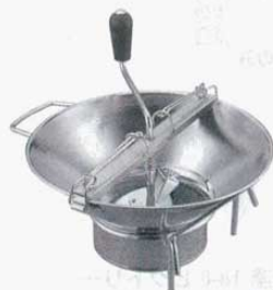
④ ムーラン X515 18-10 LT 37cm (A360 B176 C170mm) (8400300) ※1.5mmの替刃付 ※丈夫なステンレスタイプ