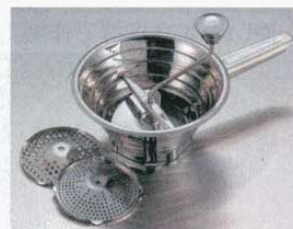
③ うらごし器 ART.451 18-10 外寸：φ200×H150mm (2902500) ※2.0・2.5・5.0mmの替刃3枚付