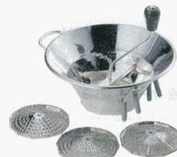
⑨ ムーラン S3 スズメッキ LT 31cm (A310 B140 C130mm) (0458500) ※1.5mm、2.5mm、4mmの替刃3枚付 ※材質：鉄スズメッキ 交換用替刃(錫メッキ) LT S3015 φ1.5 細目 (0458520) LT S3025 φ2.5 中目 (0458530) LT S3040 φ4.0 粗目 (0458540)