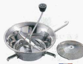
⑩ ムーラン 18-10 LT N3002 20cm (A205 B104 C83mm) (3941900) N3004 24cm (A240 B127 C100mm) (3942000) ※1.5mm、2.5mmの替刃2枚付 ※丈夫なステンレスタイプ