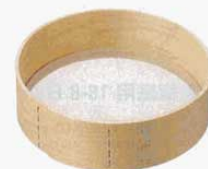
⑪ 粉フルイ(木枠) ステン張 (24メッシュ) 外寸 7寸(21cm) φ205×H75mm (0455500) 8寸(24cm) φ240×H90mm (0455600) 9寸(27cm) φ270×H90mm (0455700) R (30cm) φ300×H90mm (0455800) R1(33cm) φ330×H90mm (0455900) R2(36cm) φ355×H95mm (0456000)