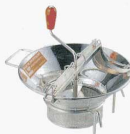
⑥ ムーラン M515 スズメッキ LT 37cm (A360 B176 C170mm) (0458400) ※1.5mmの替刃付 ※材質：鉄スズメッキ 野菜・果物等の裏漉しに使います。