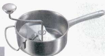
① ストレーナープレス 24100 鋼タイプ INOX Gefu (7271800) ボール：内径 190mm 高さ 80mm 全長 390mm 全高 190mm

しっかりしたINOX製であらゆる裏漉しに最適。底に付いているワイヤーが裏漉しされた食品を削ぎ落としますので、スパチュラは不要。