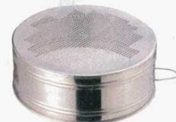
⑮ そぼろフルイ パンチング 18-8 φ245×H90mm 細目 約2.4mm目 (8333000) 荒目 約3.5mm目 (8333100)