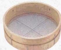
⑬ 砂糖フルイ(木枠) (10メッシュ) 7寸 φ210×H90mm (8705400) 8寸 φ240×H90mm (8705500) 9寸 φ270×H90mm (8705600) R φ300×H90mm (8705700) R1 φ330×H90mm (8705800) R2 φ360×H90mm (8705900)