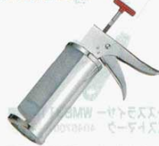
⑧ タルタルソースディスペンサー

φ86X297mm 10gタイプ(ボトル1本付) 1/3oz (0731400) 15gタイプ(ボトル1本付) 1/2oz (0731500) 交換ボトル(780cc) φ83X200mm (0731600) 材質：ステンレス(本体)、ポリエチレン(ボトル) ●タルタルソースなど固形物混入のソースが一定量ずつ取出せる、ピストル型のディスペンサーです。 ●一度の取出量が10gのもの15gのもの2種類があります。 ●ボトル一本には10g取出用で78回、15g取出用で52回が入ります。 ●カートリッジ式ですので交換ボトルをご用意になれば、大量の取出しを連続して操作できます。