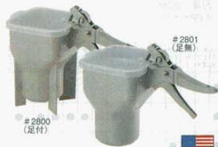
⑨ ソースポス(ポーションディスペンサー) TRAEX

φ86X297mm 10gタイプ(ボトル1本付) 1/3oz (0731400) 15gタイプ(ボトル1本付) 1/2oz (0731500) 交換ボトル(780cc) φ83X200mm (0731600) 材質：ステンレス(本体)、ポリエチレン(ボトル) ●タルタルソースなど固形物混入のソースが一定量ずつ取出せる、ピストル型のディスペンサーです。 ●一度の取出量が10gのもの15gのもの2種類があります。 ●ボトル一本には10g取出用で78回、15g取出用で52回が入ります。 ●カートリッジ式ですので交換ボトルをご用意になれば、大量の取出しを連続して操作できます。