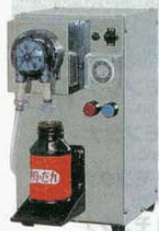
⑤ 定量充填機 TP-700型

小分太 (5467900) 230X390XH390mm 電源：単相100V 50W 能力：3,600cc/分 60cc/秒 吸上可能容器：口径10mm以上 本体ステンレス製 ●各種容器への定量充填に最適です。 ●吸い上げはパイプを差し込むだけ。 ●タイマーを量に合わせて設定、つぎたしも手動ボタンを押すだけで簡単です。