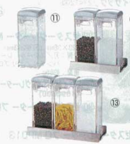
⑪ シーズニングポット

170X320XH195mm (0731200) ●ケチャップ、ソース、ドレッシング、シロップ等が連続して一定量ずつ取出せます。 ●レバーの穴の位置を変えるだけで用途に応じ2cc~12ccまで調整できる万能タイプ。 ●コンテナはステンレス製、容量は1,100cc ※スタンド(0731300)は別売です。 上外径φ145mm 下外径φ220mm 高さ250mm