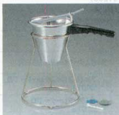
⑩ ポーションオールディスペンサー

容量：1.76ℓ ナイロン樹脂製 #2800(足付) (4650100) #2801(足無) (4650200) ●ケチャップ、マヨネーズ、ドレッシング、ソース等が連続して3cc~15cc(8段階)までの一定量で取出すことができます。