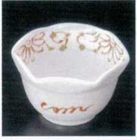
10423-734 錦万歴六角小付 550円 10×12入 (9.5×5.5cm)