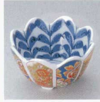
10427-734 献上錦 (古伊万里) 小付 550円 10入 (9.5×5.5cm)