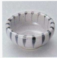
10407-454 トクサ丸小付 630円 120入 (8.3×4cm)