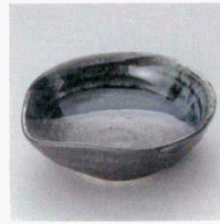
10413-114 ゆず黒流し3.0ひねり浅鉢 600円 (9.6×3.2cm)