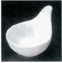
10410-054 ねじゆ石目流し香水 550円 120入 (9.1×7.2×6.5cm)