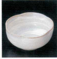
10434-124 京唐津小付 520円 150入 (8.7×4cm)