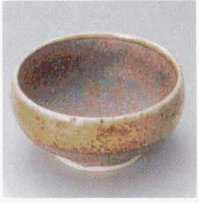
10417-264 信楽丸小鉢 600円 120入 (9×4.5cm)