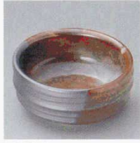
10422-264 ネズミ志野切立ケズリ小鉢 550円 120入 (8.4×3.6cm)