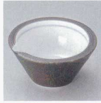
10415-174 黒伊賀片口小付 600円 120入 (9.3×4.6cm)