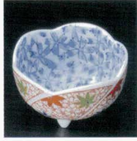
10428-734 献上錦 (春秋) 小付 550円 10×12入 (9.2×5.5cm)