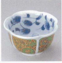
10429-734 献上錦 (グリーン唐草) 小付 550円 10入 (9.5×5.5cm)