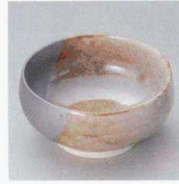
10432-264 ネズミ志野丸小鉢 550円 120入 (9×4.5cm)