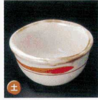
10433-134 赤絵一引厚淵小鉢 (小) 520円 (7.8×4cm)