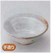
10405-574 粉引刷毛3.0反鉢 650円 (9.5×3.5cm)