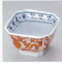
10420-734 赤濃唐草小付 550円 10×12入 (8.5×8.5×5.5cm)