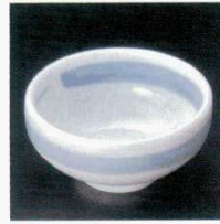
10419-144 内外コスハケメ丸珍味 580円 120入 (8.7×4.5cm)