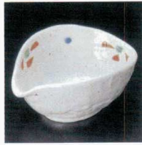
10408-234 割花片口3.6小鉢 620円 (11×5cm)