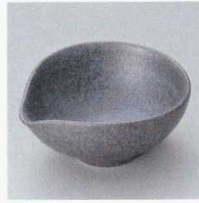
10414-304 鉄ペーパー片口ミニボール 600円 100入 (10×8.8×4.3cm)