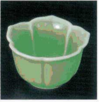
10412-554 ヒワ桔梗小付 610円 200入 (8.5×5cm)