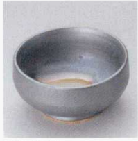
10416-264 鉄袖丸小鉢 600円 120入 (9×4.5cm)