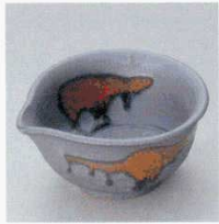
10403-244 黒やきしめ片口小鉢 700円 80入 (10×8.6×5cm)