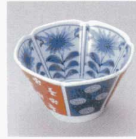
10431-734 献上錦 (コス梅千鳥) 小付 550円 10×12入 (9.5×5.5cm)