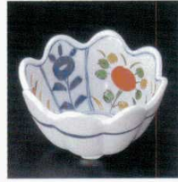
10426-734 錦立花 菊型小付 550円 10×12入 (9.7×5.5cm)