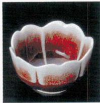
10402-264 辰砂桜小鉢 700円 160入 (9×8cm)