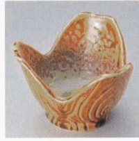
10421-034 イラボ三ツ山小鉢 550円 (9×6.5cm)