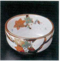
10406-314 古木モミシ珍味 640円 120入 (8.5×4.3cm)