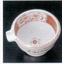
10425-734 赤濃万歴片口小付 550円 10×12入 (10×9×6cm)