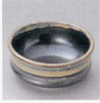
10435-264 白均窯切立ケズリ小鉢 550円 140入 (8.4×3.6cm)