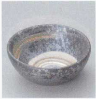
10404-664 黒窯変刷毛目珍味入 (信楽焼) 660円 (7.8×3cm)