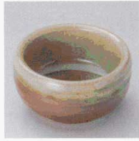
10409-234 織部流し小付 620円 100入 (8×4.2cm)