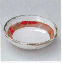
10418-574 朱巻草紋浅鉢 580円 150入 (11×2.6cm)