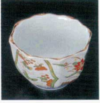
10430-734 万歴八角小付 (有田焼) 550円 10×12入 (8.5×5.5cm)