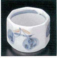
10436-444 ふる里八角小鉢 520円 100入 (7.3×6.8×5.5cm)