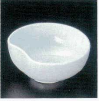
10424-294 イルタ青白磁8cmボール 500円 80入 (8×7.2×3.5cm)