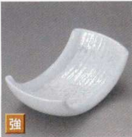
10830-564 真珠反竹珍味 900円 120入 (11.6×6.3×3.3cm)