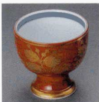
10822-254 赤絵馬上杯 2,000円 60入 (10×7.2cm)