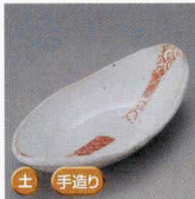
10828-304 赤絵粉引帯船形珍味 1,200円 100入 (15.2×8×3cm)