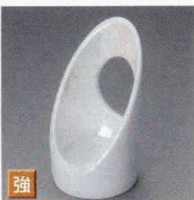
10823-514 真珠竹筒珍味 1,680円 80入 (5×9.7cm)