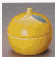
10819-454 黄ゆず珍味 (小) 1,250円 200入 (5×5cm)