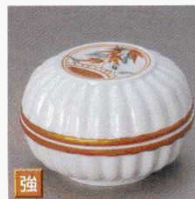
10825-144 赤絵万歴蓋付珍味 2,200円 140入 (6.7×4.5cm)