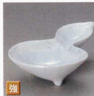
10826-564 真珠ヒサコ型珍味 1,600円 120入 (11.5×8×3cm)