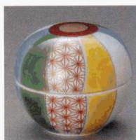
10820-294 風船フタ付珍味 2,200円 120入 (6.5×5.8cm)