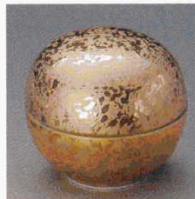
10827-294 金箔手まり珍味 1,750円 100入 (6.3×5.3cm)