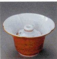
10824-294 青白赤巻小花朝顔珍味 2,150円 100入 (10.1×5.9cm)