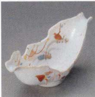
10829-164 変り舟形珍味 1,800円 80入 (16×5.8×5.5cm)