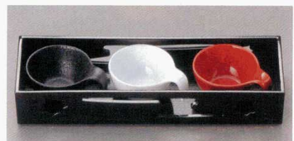
10931-164 黒壇手付珍珠 900円 80入 (10.4×7.8×4.7cm)