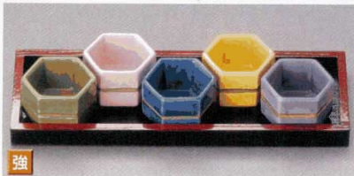
10935-554 グリーン珍珠 610円 250入 (5×3cm)