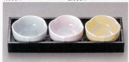
10946-294 ピンク手造風珍珠 660円 200入 (8×4cm)