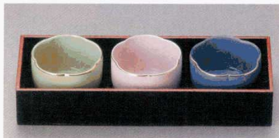
10922-234 五ツ罌ケリン口金珍珠 470円 200入 (7×4.8cm)