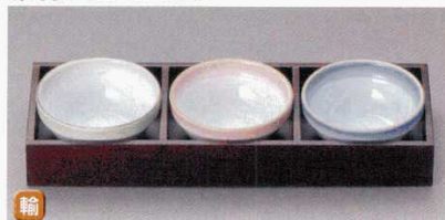
10941-134 ヒロ歌洲金丸スタック珍珠(大) 530円 (8.3×3.5cm)