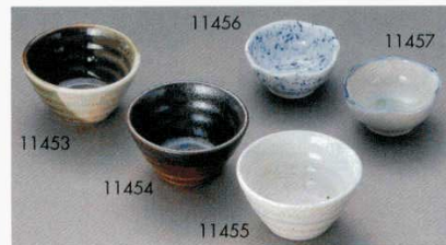
11453-454 鳴門織部小付 480円 100入 (7.4×4cm) 11454-054 白萩ツプル碗(づち) 400円 100入 (7.4×4cm・70cc) 11455-574 御深井木の葉珍味 320円 (6.5×2.6cm) 11456-054 志野化藍ツプル碗(づち) 430円 100入 (7.4×4cm・70cc) 11457-574 志野化藍ツプル碗(づち) 320円 (6.5×2.6cm)