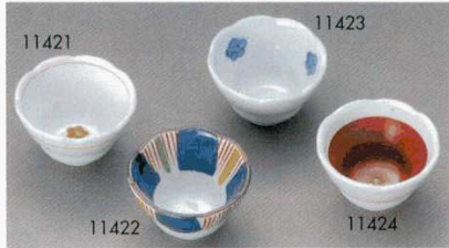
11421-734 赤い花珍味(有田焼) 530円 10×16入 (6×3.5cm) 11422-734 染付梅珍味(有田焼) 480円 10×16入 (6×3.5cm) 11423-734 彩珍味(有田焼) 550円 10×16入 (6×3.5cm) 11424-734 朱巻珍味(有田焼) 520円 10×16入 (6×3.5cm)