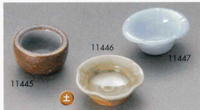
11445-454 金剛目丸珍味 690円 200入 (5.5×3.6cm) 11446-454 灰釉流し梅型平珍味 480円 200入 (7×2.4cm) 11447-454 青磁アサガオ珍味 250円 200入 (7.3×6.3×3.1cm)