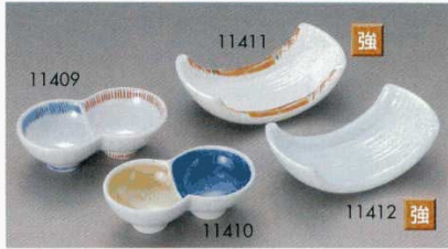
11409-734 染織十草つなぎ小付(有田焼) 1,500円 5×24入 (10×6×3cm) 11410-734 二色織つなぎ小付(有田焼) 1,450円 5×24入 (10×6×3cm) 11411-554 赤絵グリーン反竹珍味 940円 120入 (11.6×6.2×3.1cm) 11412-524 青白磁反竹珍味 780円 160入 (11.6×6.2×3.1cm)