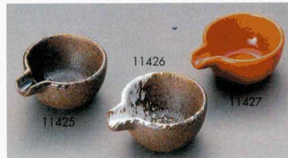
11425-454 伊賀オリバ片口珍味 390円 200入 (7.2×5.8×3.5cm) 11426-454 伊賀白吹片口珍味 390円 200入 (7.2×5.8×3.5cm) 11427-454 赤片口珍味 320円 200入 (7.2×5.8×3.5cm)