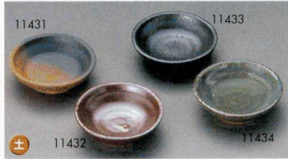
11431-414 黒南窓吹豆皿 230円 360入 (6.5×1.8cm) 11432-414 赤釉豆皿 230円 360入 (6.5×1.8cm) 11433-414 黒結晶豆皿 230円 360入 (6.5×1.8cm) 11434-414 緑豆皿 230円 360入 (6.5×1.8cm)