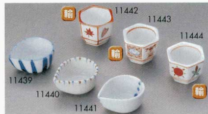
11439-524 太十草片口ミニ珍味 480円 200入 (5.5×4.5×2.5cm) 11440-524 測十草片口ミニ珍味 480円 200入 (5.5×4.5×2.5cm) 11441-524 ブチド小片口ミニ珍味 480円 200入 (5.5×4.5×2.5cm) 11442-414 春秋ぼんぼり型珍味 210円 360入 (4.5×4×3.3cm) 11443-414 山水ぼんぼり型珍味 210円 360入 (4.5×4×3.3cm) 11444-414 丸敷ぼんぼり型珍味 210円 360入 (4.5×4×3.3cm)