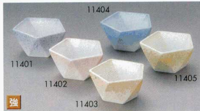
11401-554 ラスター藍ダイヤ型珍味 1,300円 180入 (8×8×4cm) 11402-554 ラスターピンクダイヤ型珍味 1,300円 180入 (8×8×4cm) 11403-554 ラスター黄ダイヤ型珍味 1,300円 180入 (8×8×4cm) 11404-554 ラスターブルーダイヤ型珍味 1,300円 180入 (8×8×4cm) 11405-554 ラスターヒョウダイヤ型珍味 1,300円 180入 (8×8×4cm)