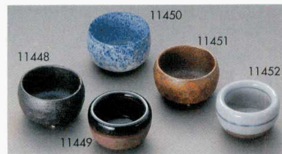
11448-434 黒伊賀3つ足珍味(大) 410円 200入 (5.9×3.6cm) 11449-434 吹墨三つ足(大)珍味 410円 200入 (6×4cm) 11450-434 吹墨三つ足(小)珍味 410円 200入 (6×4cm) 11451-434 信楽オバ3つ足珍味(大) 420円 300入 (5.9×3.6cm) 11452-434 唐津一本筋丸珍味 520円 (5.6×3.5cm)