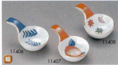
11406-414 草紋ミニレンゲ珍味入 400円 200入 (8.5×5.8×3.6cm) 11407-414 椿ミニレンゲ珍味入 400円 200入 (8.5×5.8×3.6cm) 11408-414 春秋ミニレンゲ珍味入 400円 200入 (8.5×5.8×3.6cm)