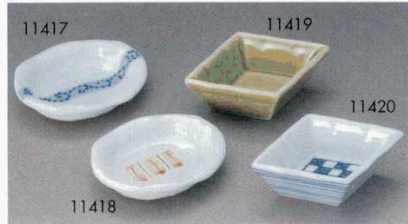
11417-734 ライン清草欄門豆皿(有田焼) 830円 5×32入 (8.5×7×1.5cm) 11418-734 線十草欄門豆皿(有田焼) 830円 5×32入 (8.5×7×1.5cm) 11419-734 緑梅菱型珍味(有田焼) 450円 10×16入 (9×6.5×3cm) 11420-734 瀟市松菱型珍味(有田焼) 470円 10×16入 (9×6.5×3cm)