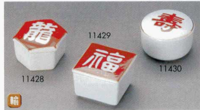
11428-414 龍鳳蓋付亀甲珍味入 500円 120入 (5×6×3.3cm) 11429-414 福蓋付角珍味入 400円 120入 (5.2×5.2×3.9cm) 11430-414 寿蓋付丸珍味入 400円 120入 (5.7×3.5cm)