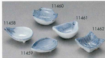
11458-524 ナスピ豆珍味 190円 300入 (6×4.5×2cm) 11459-524 タイ豆珍味 190円 300入 (5.7×4.5×2cm) 11460-524 フグ豆珍味 190円 300入 (5.7×4.5×2cm) 11461-524 四ツ葉豆珍味 190円 300入 (4.5×2cm)