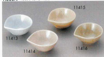
11413-454 淡青しずく珍味 260円 300入 (6.5×6×3cm) 11414-454 さくらしずく珍味 260円 300入 (6.5×6×3cm) 11415-454 秋草しずく珍味 260円 300入 (6.5×6×3cm) 11416-454 若草しずく珍味 260円 300入 (6.5×6×3cm)