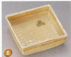
12025-514 黄瀬戸角小鉢 1,350円 80入 (11×3.6cm)