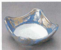
12018-524 金彩輪花松花堂 1,760円 120入 (11×11×4.4cm)