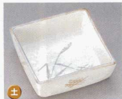
12024-514 志野角小鉢 1,350円 80入 (11×3.6cm)