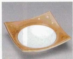
12019-164 朱巻金点角皿 1,650円 120入 (11.3×11.3×2.6cm)