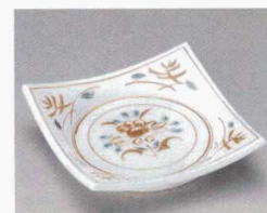
12021-144 赤絵四方皿 1,500円 120入 (11.2×11.2×2.5cm)