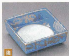
12017-524 金彩輪花四角松花堂 1,870円 80入 (11.2×11.2×3.7cm)