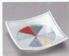
12022-294 絵変わり四方皿 1,400円 100入 (11.5×11.5×2.5cm)