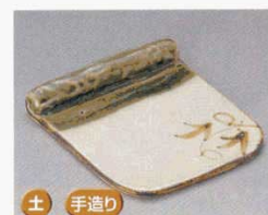
12016-444 手造織部つる草巻皿小 3,000円 40入 (11.5×10×1.5cm)