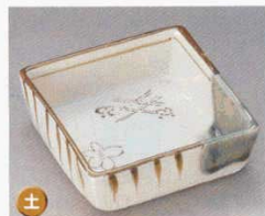
12023-514 織部角小鉢 1,350円 80入 (11×3.6cm)