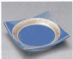
12020-144 淵金ブルー金唐草四方皿 1,600円 120入 (11.5×11.5×2.5cm)