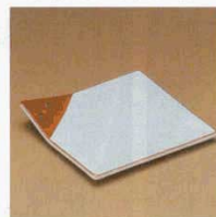
12234-434 赤点平角皿 940円 150入 (11.5×1.5cm)