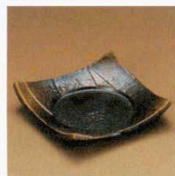
12231-454 焼松花堂四方皿 970円 80入 (11.1×11.1×2.6cm)