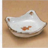
12210-184 魚紋角鉢 1,150円 60入 (11×11×3.7cm)