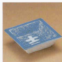
12219-454 吹墨吉角鉢 1,080円 100入 (11.3×11.3×3.5cm)