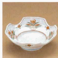
12225-174 四ツ切赤絵万歴小鉢 1,000円 150入 (11.7×4.1cm)