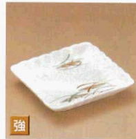
強 12206-114 武蔵野菊形角皿 1,200円 120入 (11.3×2cm)