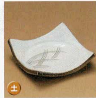
土 12202-164 粉引正角皿 1,450円 120入 (11×11×2.7cm)