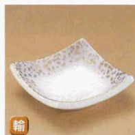
輸 12224-314 紫吹金箔布目正角厚淵皿(大) 1,000円 (11×3.5cm)