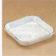
12218-414 手まりなで角皿 1,100円 120入 (11.5×11.5×2cm)