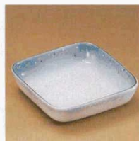
12230-554 武蔵野松花堂 950円 120入 (11.5×11.5×2.8cm)