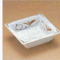
12213-454 花唐草角鉢 1,150円 100入 (11.3×11.3×3.5cm)