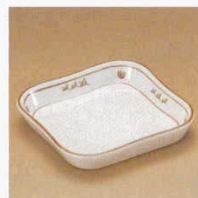
12222-414 赤絵格子なで角皿 1,100円 120入 (11.5×11.5×2cm)