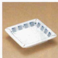
12223-144 十草角鉢 1,000円 100入 (10.8×10.8×2cm)