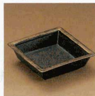
12236-264 角鉢金彩 900円 120入 (11.5×11.5×3.5cm)