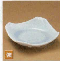
強 12203-554 青白磁富士山型浅鉢 1,250円 120入 (11.1×11.1×3.2cm)