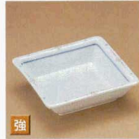
強 12207-554 淵赤絵正角鉢 1,200円 100入 (11×11×3.1cm)