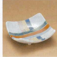
12216-164 糸巻角皿 1,100円 120入 (11×11×4cm)