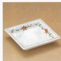
12226-254 赤絵弁当皿 1,000円 120入 (11×11×2.3cm)