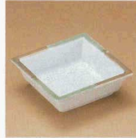
12211-434 ヒワ金角鉢(大) 1,150円 120入 (11.5×3.5cm)