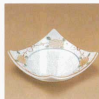
12221-184 花唐草四方皿 1,030円 80入 (11.2×11.2×3cm)