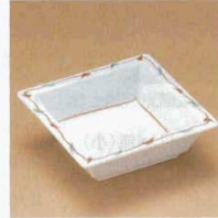
12214-454 花やなぎ角鉢 1,150円 100入 (11.3×3.5cm)