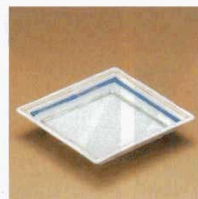
12228-414 色絵うす4.0角皿 950円 120入 (10.6×10.6×2.1cm)