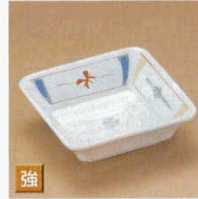
強 12208-134 染錦見込小花角鉢 1,200円 100入 (10.2×10.2×3.3cm)