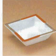
12215-434 赤金角鉢(大) 1,150円 120入 (11.5×3.6cm)