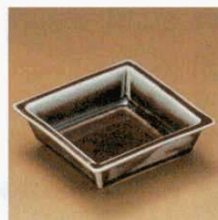
12229-264 辰砂松花堂角鉢 950円 100入 (11.5×11.5×3.5cm)