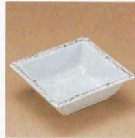
12205-434 ススキ野角鉢 1,150円 120入 (11.5×3.5cm)