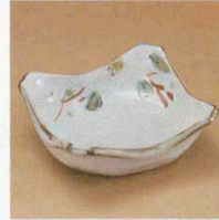
12209-184 椿角鉢 1,150円 120入 (11×11×3.7cm)