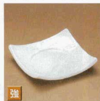
強 12235-244 白強化松花堂四方皿 910円 120入 (11×11×2.5cm)