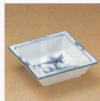
12227-454 古染桔梗角鉢 950円 100入 (11.3×11.3×3.5cm)