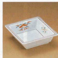
12233-184 赤絵花四角鉢 960円 80入 (11.2×3.5cm)