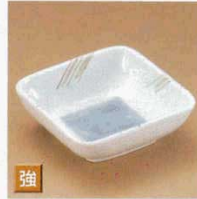
強 12212-554 青地夕夕色十草松花堂 1,150円 100入 (10.8×10.8×3.8cm)