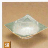
強 12220-554 緑彩松花堂 1,050円 120入 (11×11×3.8cm)