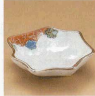
12217-184 雲錦八ツ手鉢 1,100円 60入 (12×11×3.5cm)