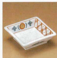
12232-164 赤絵角小鉢 980円 80入 (10.5×10.5×2.8cm)