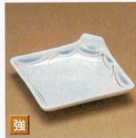
強 12201-554 赤絵すだれ角折型皿 1,400円 120入 (10.8×10.8×3.2cm)