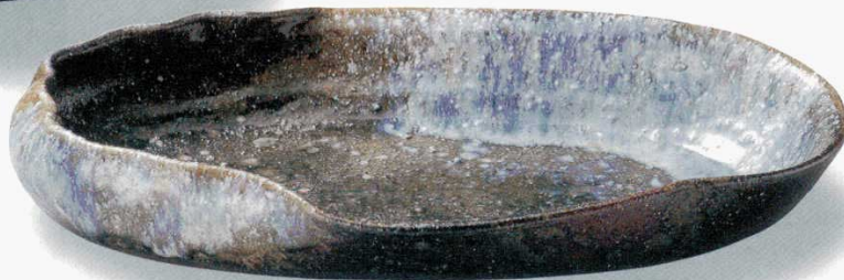
01304-664 焼ビードロ16.0小判鉢(信楽焼) 12,000円 (48×30×6.5cm) 01305-664 焼ビードロ13.0小判鉢(信楽焼) 7,150円 (39×23.5×6cm)