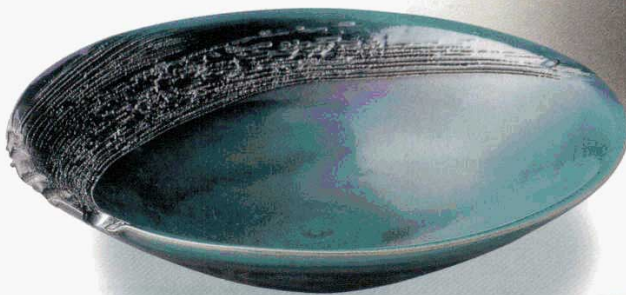
01301-664 緑袖13.7皿鉢(信楽焼) 27,500円 (41×10cm) 01302-664 緑袖11.0皿鉢(信楽焼) 10,000円 (35×7cm)