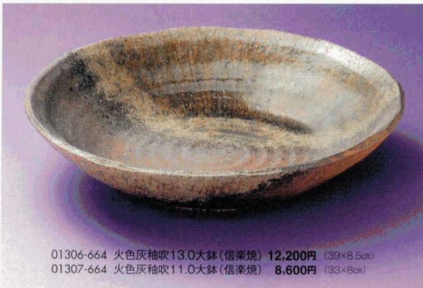
01306-664 火色灰釉吹13.0大鉢(信楽焼) 12,200円 (39×8.5cm) 01307-664 火色灰釉吹11.0大鉢(信楽焼) 8,600円 (33×8cm)