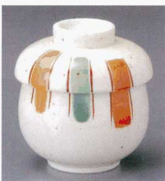
14118-134 梨地三色十草京型むし碗 950円 80入 (7×8.5cm・190cc)