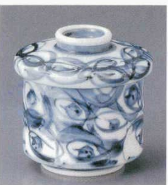
14109-554 水泡むし碗 1,000円 80入 (7.2×8.5cm・160cc)