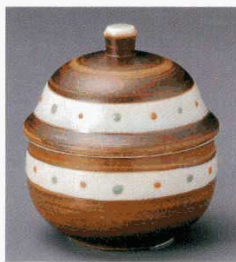
14106-544 サビ朱水玉鈴むし碗 1,250円 160入 (7.8×9.5cm・170cc)