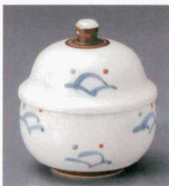
14107-544 水晶オオギ水玉鈴むし碗 1,250円 160入 (7.8×9.5cm・170cc)