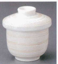
14130-554 白マット刷毛目むし碗 520円 80入 (8.2×9.5cm・230cc)