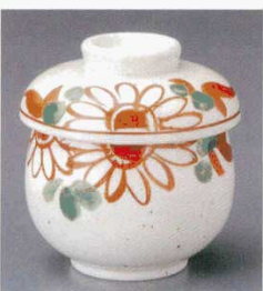
14113-134 梨地万歴京型むし碗 1,000円 80入 (7×8.5cm・190cc)