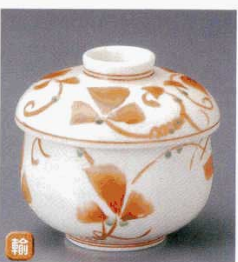
14104-134 赤絵一引むし碗 1,150円 (7.5×8.5cm・180cc)