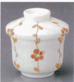
14124-564 アイボリー若葉むし碗 930円 80入 (8.3×9cm・250cc)