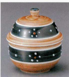
14103-544 グリーン鈴むし梅 1,300円 80入 (7.8×9.5cm・170cc)