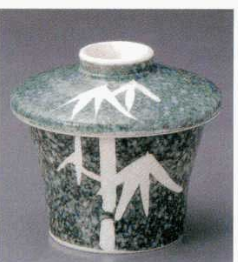
14116-114 グリン淡雪竹むし碗 980円 80入 (9×9.5cm・200cc)