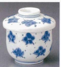
14121-564 綿押梅むし碗 930円 80入 (8.3×9cm・250cc)