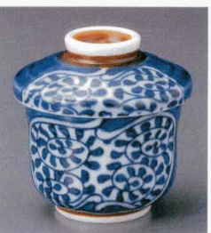
14110-564 藍の里むし碗(小) 1,000円 80入 (7.5×8.2cm・180cc)