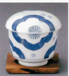
14114-144 一珍梅 1,000円 50入 (9×8.5cm・200cc)