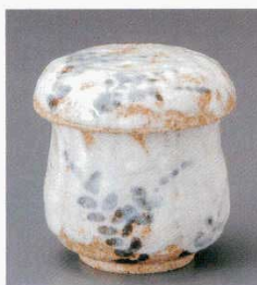
14101-554 志野タタキ芦むし碗 1,200円 80入 (7.7×8.5cm・120cc)