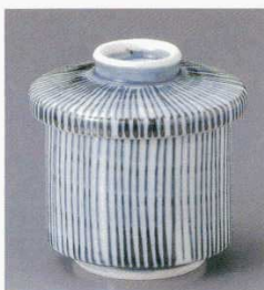
14102-554 千筋十草むし碗 1,200円 80入 (7.2×8.5cm・160cc)