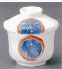
14119-544 ニューボン丸紋小花むし碗(小) 1,050円 80入 (7.3×8.5cm・160cc)