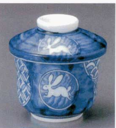
14126-564 京祥瑞むし碗 860円 80入 (8.3×9cm・250cc)