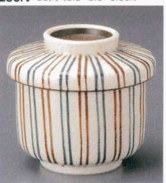
14120-574 二色十草蒸し碗 950円 60入 (8×8.2cm・230cc)