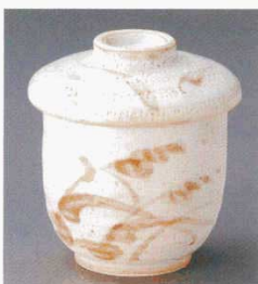
14112-024 白志野むし碗 1,100円 10×8入 (7.8×10cm・210cc)