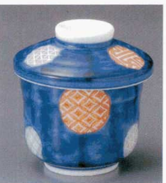
14128-564 ダミ丸紋むし碗 900円 80入 (8.3×9cm・250cc)