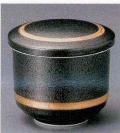
14108-314 ウズ金むし碗 1,000円 80入 (8×7.8cm・230cc)