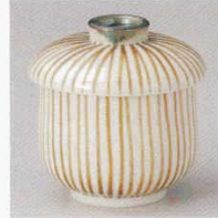
14611-524 織部十草むし碗 1,270円 80入 (8×7.8cm)