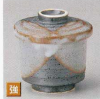
14615-554 志野塗分むし碗(小) 1,100円 80入 (7.5×7.5cm・120cc)