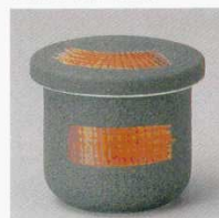
14625-234 伊賀ハケメミニむし碗 650円 100入 (6.5×7.5cm・130cc)