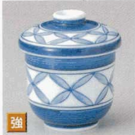
14614-524 コス巻七宝むし碗 1,100円 80入 (6.3×8.8cm)