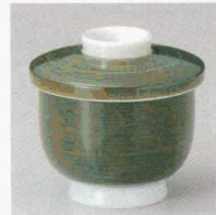
14632-284 クリン小むし碗 770円 100入 (6.7×7.5cm・140cc)