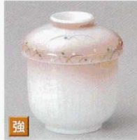
14604-554 ピンク吹武蔵野むし碗 1,650円 80入 (7×8.5cm・160cc)