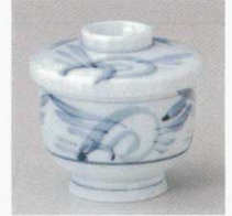
14618-294 砥部風小蒸碗 950円 100入 (7.7×7.5cm・140cc)