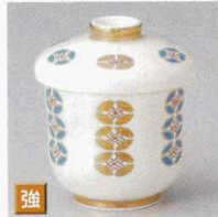
14607-554 丸紋むし碗(小) 1,450円 80入 (6.3×8.8cm)