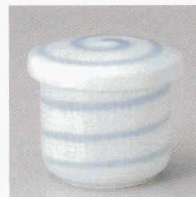
14628-284 白磁滴小むし碗 590円 100入 (6.5×7cm・120cc)