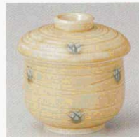
14619-564 黄瀬戸むし碗(小) 920円 80入 (7×8cm・150cc)