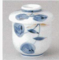
14605-444 ふる里小むし碗 1,520円 100入 (6.5×8cm・130cc)