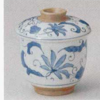
14616-564 菊唐草むし碗(小) 1,050円 80入 (6.6×8cm・140cc)