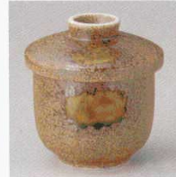
14635-024 伊賀風小むし碗 490円 80入 (7.2×8.5cm・170cc)