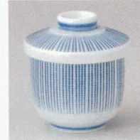
14636-024 細十草小むし碗 460円 80入 (7.2×8.5cm・170cc)