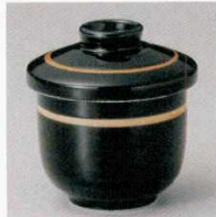
14633-024 黒茶オビ小むし碗 490円 80入 (7.2×8.5cm・170cc)