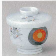
14621-284 ふる里小むし 860円 100入 (6.7×7.5cm・140cc)