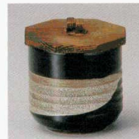
14629-024 刷毛目ミニむし(蓋付) 440円 20×5入 (6.5×6.2cm・120cc) 14630-024 八角木蓋のみ 150円 (7×7cm)