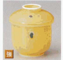
14606-524 黄輝むし碗 1,500円 80入 (6.8×8.5cm・170cc)