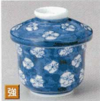
14608-524 梅つくしむし碗(小) 1,450円 80入 (7.2×8.3cm・160cc)