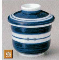
14610-564 緑水玉むし碗(小) 1,300円 80入 (8×8.5cm・180cc)