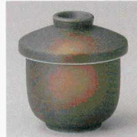
14634-024 備前吹小むし碗 490円 80入 (7.2×8.5cm・170cc)