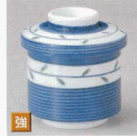
14617-554 花つなぎむし碗 1,000円 80入 (6.7×8cm・150cc)