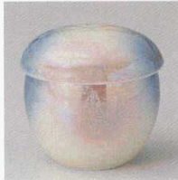
14603-164 ラスター銀彩二色吹むし碗(小) 1,850円 50入 (6.5×7cm・140cc)