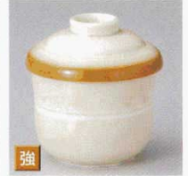
14612-524 黄彩むし碗 1,260円 80入 (7.2×8.6cm)