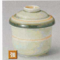
14613-554 緑彩金筋むし碗 1,260円 80入 (7.2×8.9cm・160cc)