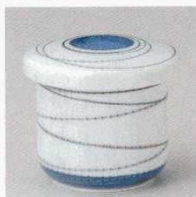
14626-234 クン目(ミニ)むし碗 640円 100入 (6.5×7.5cm・130cc)