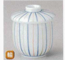
14624-184 二色トクサ小むし碗 800円 60入 (6.7×8cm)