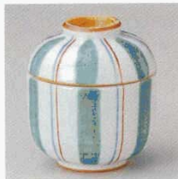
14601-254 緑交趾十草小むし碗 2,530円 80入 (7.2×8cm・110cc)