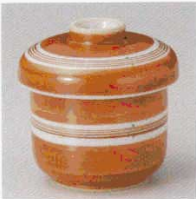
14602-304 赤巻小むし碗 2,050円 80入 (7.5×9cm・160cc)