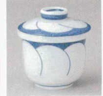
14637-284 梅割ミニむし碗 400円 100入 (7×8cm・170cc)