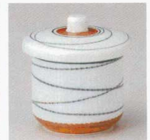
14631-284 赤ウス(小)むし碗 590円 20×5入 (6.5×7.5cm・120cc)