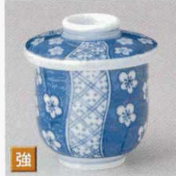
14609-544 梅祥瑞小むし碗 1,450円 100入 (7.5×8.3cm・140cc)