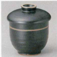
14620-564 黒鉄砂むし碗(小) 880円 80入 (6.6×8cm・140cc)