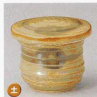
14627-234 オリベ流しミニむし碗 620円 100入 (6.5×7cm・110cc)