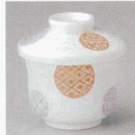
14622-564 源氏丸紋むし碗(小) 830円 80入 (7.3×8.6cm・180cc)