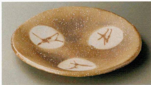
15011-664 焼ぐ 15.0大皿(信楽焼) 28,600円 (45×6cm) 15012-664 焼ぐ 11.0大皿(信楽焼) 10,000円 (33×5cm)