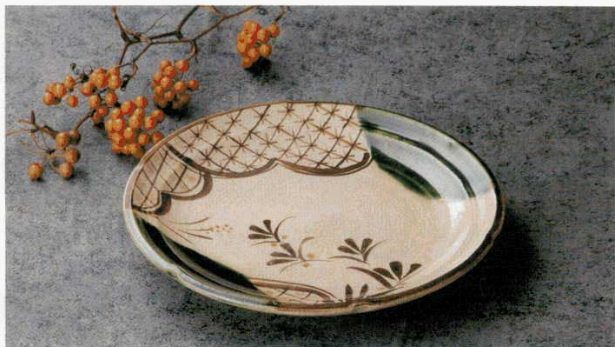
15006-524 織部立花12.0皿 30,000円 5入 (37.8×6cm) 15007-524 織部立花10.0皿 17,800円 10入 (31.5×5.5cm) 15008-524 織部立花8.0皿 8,800円 20入 (25.5×3.7cm)