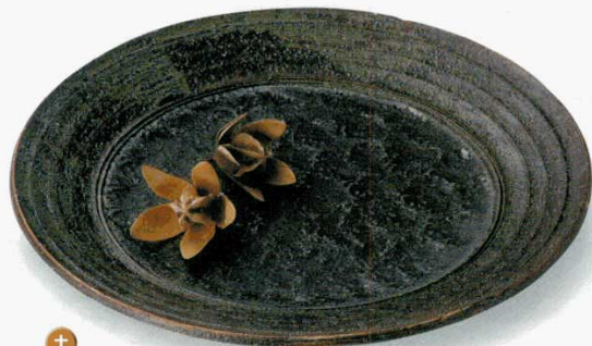
土 15013-144 唐津ゴス石たたき13.0皿 38,000円 5入 (41×4cm)