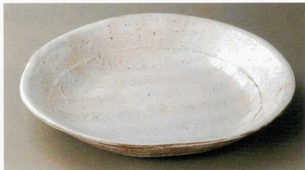
15014-664 荒土しのぎ手13.0大鉢(信楽焼) 43,000円 (40×6cm) 15015-664 荒土しのぎ手12.0大鉢(信楽焼) 28,600円 (36×5.5cm)