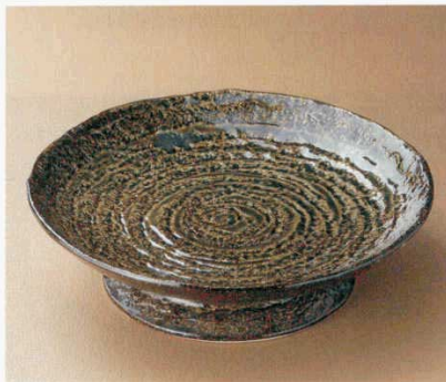
15310-314 グリン尺高台皿 4,950円 5入 (30.5×7.8cm)