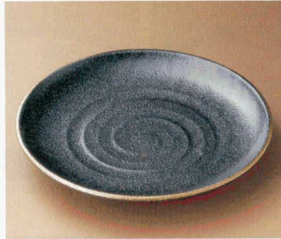
15302-024 いぶし金10.0大皿 7,800円 20入 (30.5×4.5cm)