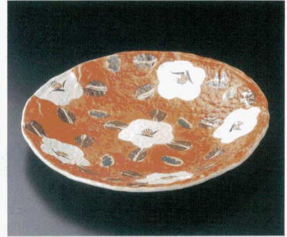
15303-524 赤濃山茶花丸大皿 7,700円 20入 (32.5×4.3cm)