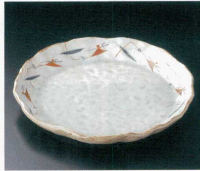
15308-544 ツウ草尺波型盛皿 8,900円 12入 (31×4cm)