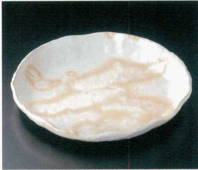
15304-574 粉引線刻尺丸浅鉢 5,000円 10入 (30.6×4cm)