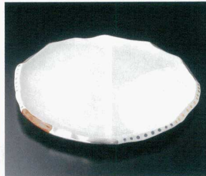
15311-134 色絵銀彩舞丸尺大盛皿 5,500円 (33×32×3.5cm)