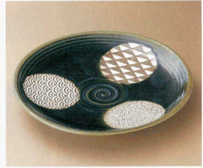
15309-564 現代織部丸大皿 4,850円 10入 (30.7×4.5cm)