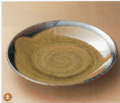
15306-304 伊賀三ツ星尺皿 7,200円 10入 (32×4.5cm)