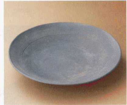
15312-664 炭化10.0丸皿(信楽焼) 7,150円 (30×4.5cm)