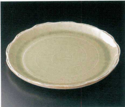
15301-664 萌黄12.0丸皿(信楽焼) 9,680円 (36×3cm)