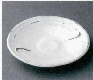
15702-174 粉引拭取り8寸深皿 2,650円 25入 (24.3×3.8cm)