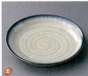
15705-134 藍流し8寸皿 2,700円 (25.3×3.8cm)