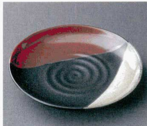
15719-264 トリプル丸8.5皿 1,500円 24入 (26×3.1cm)