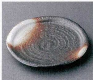
15713-234 潮騒丸8.0リムバスタ皿 1,350円 30入 (24.5×2.3cm)