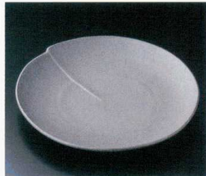
15708-294 鉄ベツパーハス大皿 2,400円 40入 (24.2×2.9cm)