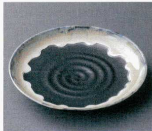
15711-264 白均窯流し丸8.5皿 1,500円 24入 (26×3.1cm)