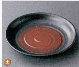
15704-134 赤吹8寸皿 2,700円 (25.3×3.8cm)