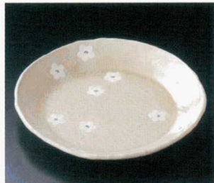
15716-554 8.0丸盛皿白い花 3,400円 30入 (25×3.5cm)