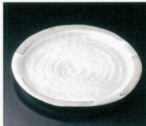
15715-474 蔵間8.0波皿 1,350円 30入 (24.5×3cm)