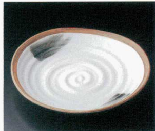
15720-264 白御影三角六兵衛9寸皿 1,300円 20入 (27.5×4.2cm)