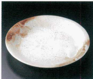
15717-174 雪志野9.0深皿 1,150円 20入 (28×3.7cm)