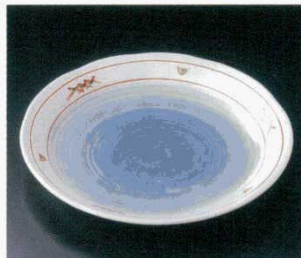
15714-444 赤絵海流バスタ皿 980円 30入 (24×3.2cm)