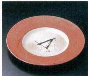
15706-244 赤釉リム付丸皿 2,450円 30入 (25.9×25.9×2.6cm)