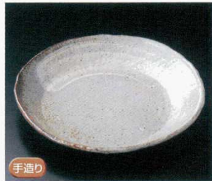
15712-574 粉引刷毛8.5丸皿 3,600円 (25.8×3.5cm)