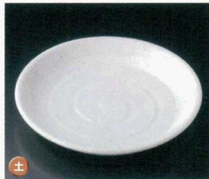
15710-304 粉引8.0皿 2,450円 30入 (25×3.7cm)