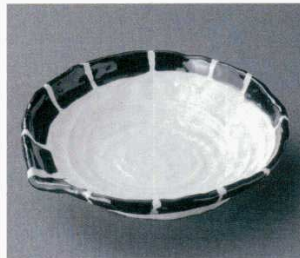
15707-134 黒十草片口盛皿 3,200円 (25.5×25×5.3cm)