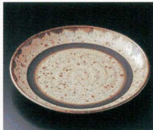
15718-264 砥部釉丸8.5皿 1,000円 24入 (26×3.5cm)