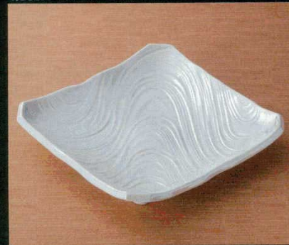
16216-734 ラスター渦盛皿 (有田焼) 9,900円 3×3入 (31.5×31.5cm)