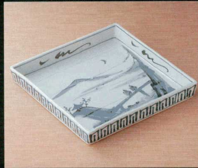
16208-304 山水四方皿 13,400円 5入 (31×31×4.5cm)