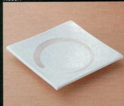
16210-734 プラチナ輝10号角皿 (有田焼) 13,200円 5×4入 (30×30×6cm) 16211-734 プラチナ輝8号角皿 (有田焼) 8,260円 5×4入 (25×25×4cm) 16212-734 プラチナ輝6号角皿 (有田焼) 4,950円 5×12入 (19×19×2.5cm)