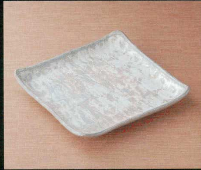
16209-294 御本粉引足付正角皿 14,300円 15入 (30.5×30.5×4.5cm)