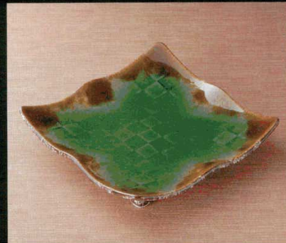
16213-734 線軸イラボ角波測 (大) 盛皿 (有田焼) 10,500円 2×6入 (29×29×7.5cm) 16214-734 線軸イラボ角波測 (中) 盛皿 (有田焼) 7,700円 2×8入 (24.5×24.5×7cm)