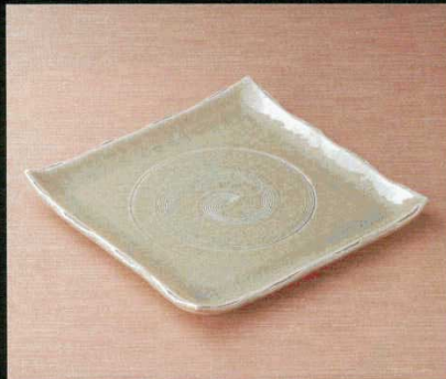
16204-664 萌黄12.0正角皿 (信楽焼) 13,200円 (36×36×3cm) 16205-664 萌黄10.0正角皿 (信楽焼) 6,000円 (30×30×3cm)