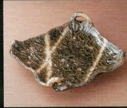
16218-174 織部小紋手付尺1盛皿 8,500円 7入 (34×9cm)