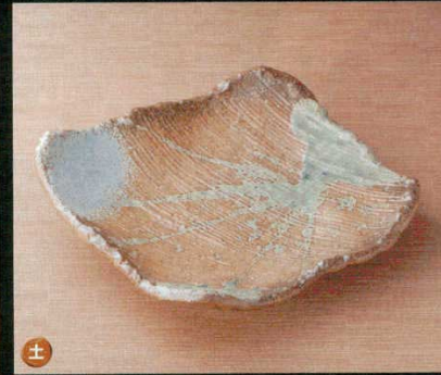
16217-174 信楽風砂目正角尺皿 8,200円 10入 (32.5×31.2×5.5cm)