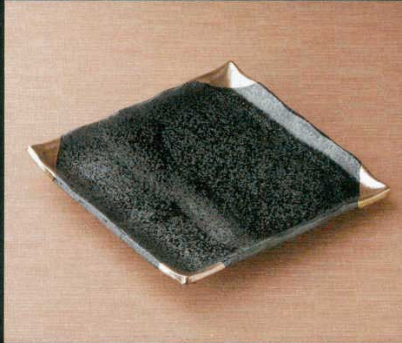
16304-264 金彩正角大皿 6,000円 10入 (29×29×3.8cm) 16305-264 金彩正角盛皿 3,500円 20入 (23×23×3cm)