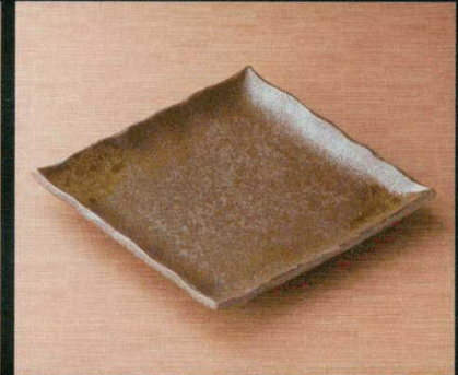
16307-264 南蛮鉄織部正角大皿 5,000円 10入 (29×29×3.8cm)