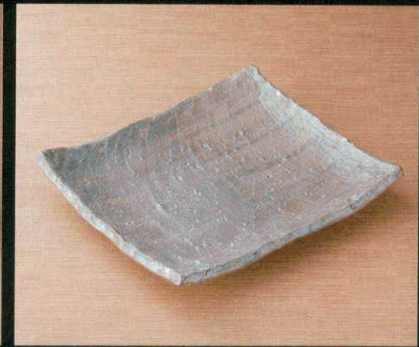
16303-134 銀彩長角尺皿 6,500円 15入 (30×26×5cm)