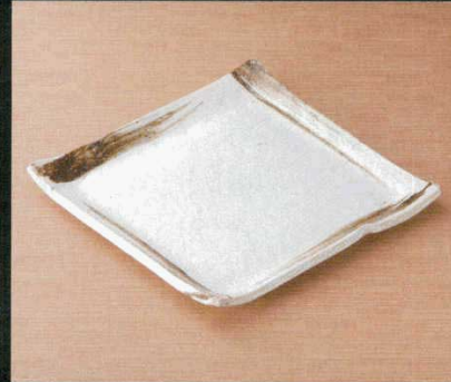
16306-664 鉄刷毛目10.0正角皿(信楽焼) 6,300円 (30×30×3cm)