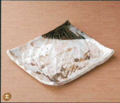
16308-174 オリベ古木正角大皿 5,400円 10入 (31×27.3×2.8cm)