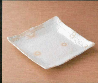
16309-574 粉引線彫正角大皿 5,500円 10入 (28.5×4.5cm)