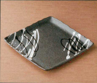
16311-314 鉄黒乱線紋正角10.0皿(軽量磁器) 4,000円 (29.4×29.4×2.6cm) 16312-314 鉄黒乱線紋正角8.0皿(軽量磁器) 3,000円 (24.7×24.7×2.2cm)