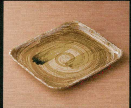
16314-314 黄瀬戸オリベ四角大皿 2,450円 20入 (29.7×25.8×2.5cm)