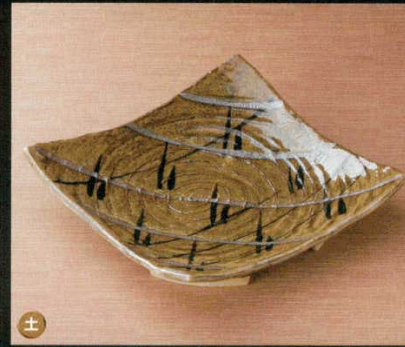
16302-174 伊賀風格子正角盛込皿 7,300円 15入 (31.3×6.5cm)