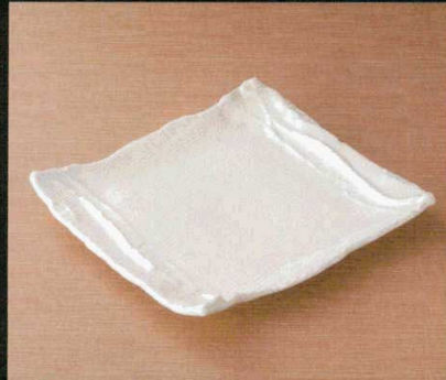
16313-114 定窯竹節正角尺一寸皿 3,700円 10入 (30.7×28.5×5cm)