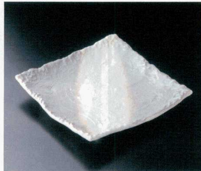
16511-644 かすみ志野10号四ツ足正角皿 (萬古焼) 2,400円 15入 (31×31×5.3cm) 16512-644 かすみ志野8号四ツ足正角皿 (萬古焼) 1,650円 20入 (26×26×5.5cm)