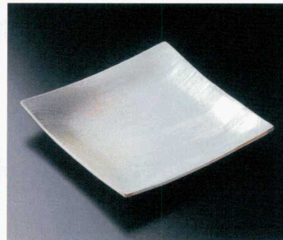
16505-274 風紋手引正角9.0皿 3,800円 20入 (28.5×28.5×4.5cm)