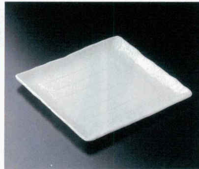
16508-284 白マット尺盛皿 2,650円 15入 (31.5×31.5×2.8cm)