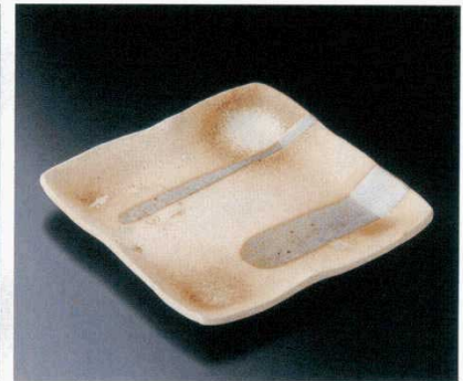
16503-664 火色ピート口9.0角皿 (信楽焼) 3,850円 (27.5×27.5×3cm)