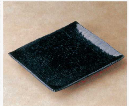
16509-164 海碧長角皿 2,550円 15入 (30×26.5×4cm)