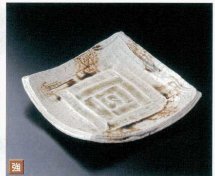
16506-174 ピードロ八五角盛皿 3,600円 15入 (28×26×5.5cm)