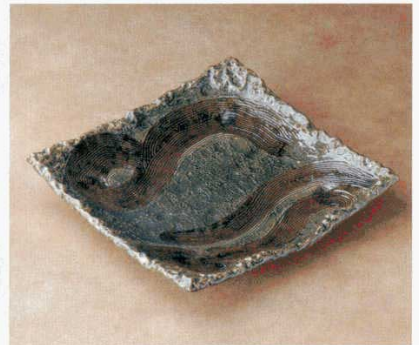
16513-644 織部10号四ツ足正角皿 (萬古焼) 2,400円 15入 (31×31×5.3cm) 16514-644 織部8号四ツ足正角皿 (萬古焼) 1,650円 20入 (26×26×5.5cm)