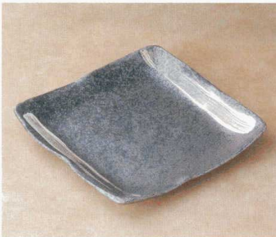
16504-664 黒窯変刷毛目9.0角皿 (信楽焼) 3,850円 (27.5×27.5×3cm)