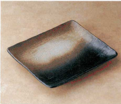
16507-474 黒備前吹特大盛皿 2,900円 10入 (30×26×4.5cm)