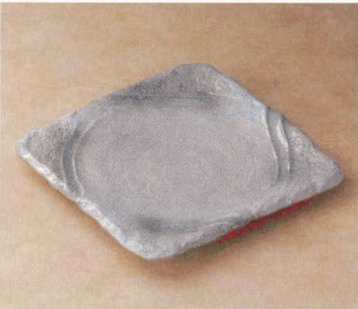
16510-634 乳白10号正角皿 (萬古焼) 2,500円 20入 (30.5×30.5×4cm)