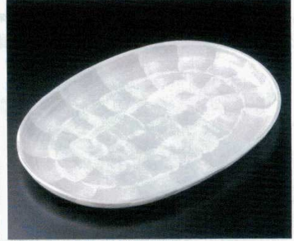
17808-564 乳白志野13号小判皿 5,500円 5入 (39.3×27.8×2.5cm)