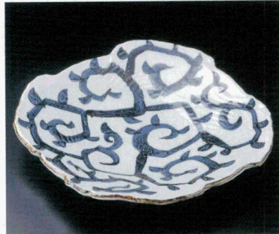
17806-294 新たこ唐草なで角尺一皿 7,000円 15入 (31.5×31.5×4.8cm)