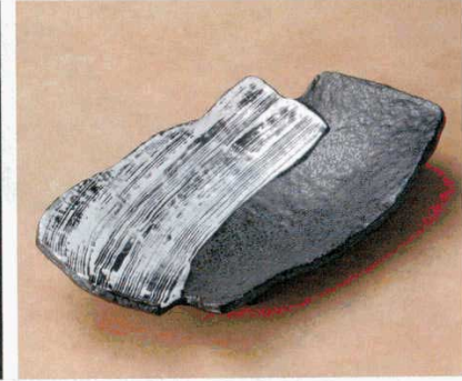
17815-174 炭化土白刷毛目2枚重ね尺2皿 4,400円 10入 (37×22.5×7.5cm)