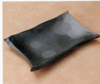
17809-134 炭化土ちぎり盛皿 5,400円 20入 (35×22.5×4.5cm)