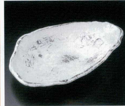
17814-244 粉引変形大皿 4,500円 20入 (36.9×23.6×4.9cm)