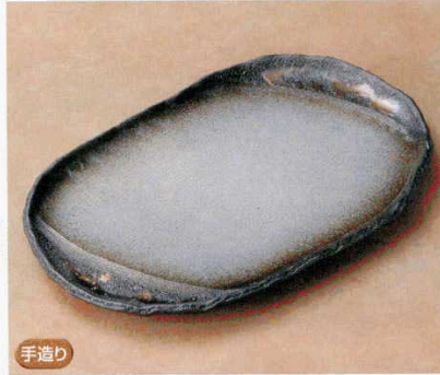
17801-634 わかば13号小判皿(手造り)(萬古焼) 9,300円 15入 (41×27.5×3.5cm) 17802-634 わかば9号小判皿(手造り)(萬古焼) 4,400円 25入 (27.5×20×3cm)