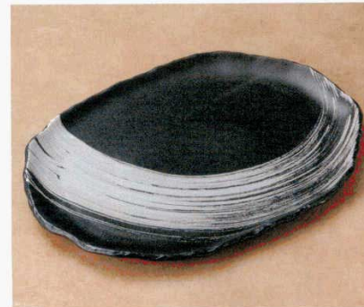
17812-644 黒釉刷毛目13号小判皿(萬古焼) 3,100円 12入 (39.5×29.3×3cm) 17813-644 黒釉刷毛目11号小判皿(萬古焼) 2,550円 15入 (34×25.3×3cm)