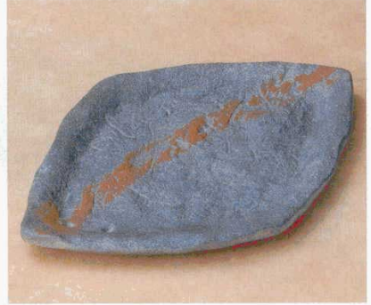
17805-664 暁12.8変形皿 8,800円 (38.3×27×2.5cm)