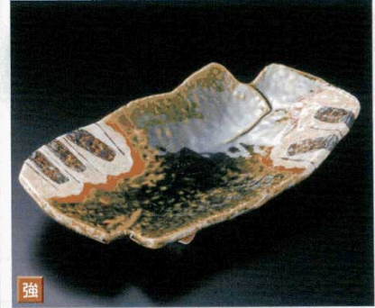
17810-164 オリベ風車大盛皿 5,400円 10入 (41.2×32×3.5cm)