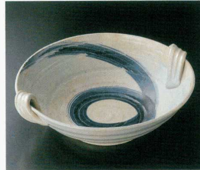
01811-644 呉須刷毛目9号手付盛鉢(萬古焼) 3,700円 10入 (31.5×28.7×10cm)