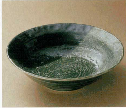
01802-454 木影トチ目リム尺皿 5,800円 12入 (31×8.8cm)