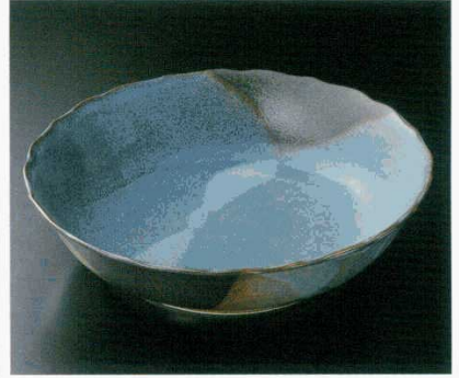
01803-454 湖水尺盛鉢 6,000円 15入 (32×8.3cm)