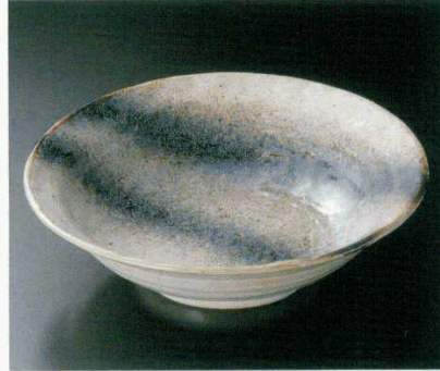
01805-574 銀河石目リム尺鉢 4,700円 (31×8.8cm)