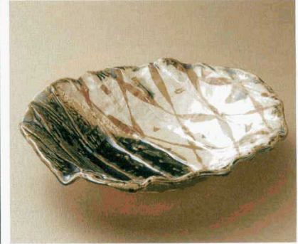
01812-574 織部格子甲羅鉢(大) 5,200円 (30.5×28.5×6.8cm) 01813-574 織部格子甲羅鉢(小) 2,400円 (23×21.8×5.5cm)