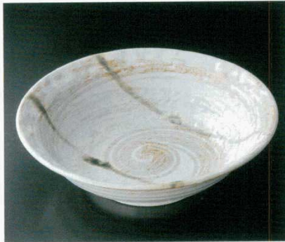
01801-054 飛翠石目リム尺鉢 6,000円 10入 (31×8.8cm)