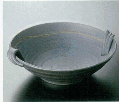
01808-644 燻し9号手付盛鉢(萬古焼) 3,700円 10入 (31.5×28.7×10cm)