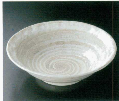
01807-174 東風リム尺井 4,500円 20入 (31×9cm)