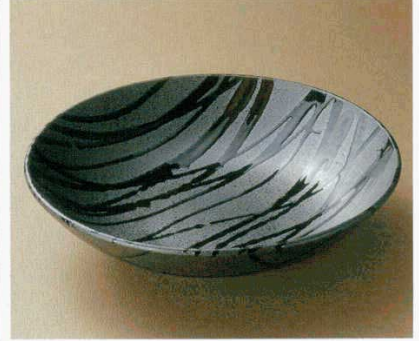
01806-474 黒伊賀十草流10.0大鉢 5,300円 10入 (30×7.8cm)