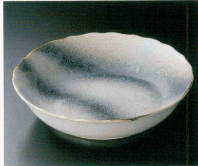
01804-454 流星尺盛鉢 5,500円 15入 (32×8.3cm)