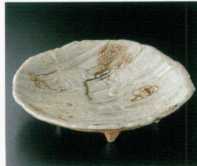
01810-174 ビードロ尺寸大盛鉢 5,300円 12入 (31×7cm)