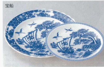
宝船 18427-654 13号雪輪皿(萬古焼) 3,800円 10入 (42×5.5cm) 18428-654 12号皿(萬古焼) 2,300円 15入 (37×4cm)