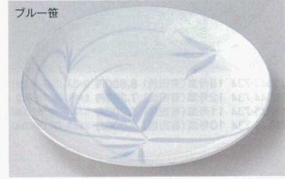
ブルー笹 18423-654 高台皿10号(萬古焼) 1,750円 20入 (32×5cm) 18424-644 13号丸皿(萬古焼) 4,000円 10入 (42.5×5cm) 18425-644 12号丸皿(萬古焼) 2,300円 14入 (37×4.5cm)