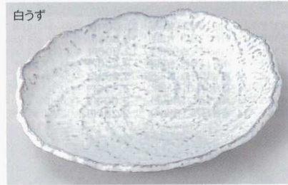
白うず 18414-654 10号皿(萬古焼) 2,000円 20入 (30.5×26.5×3.8cm) 18415-654 8号皿(萬古焼) 1,200円 30入 (24.5×21.5×3.5cm)