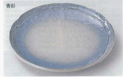
青彩 18416-634 10号丸皿(萬古焼) 2,900円 20入 (30.5×3.5cm) 18417-634 8号丸皿(萬古焼) 1,800円 30入 (24×2.5cm)