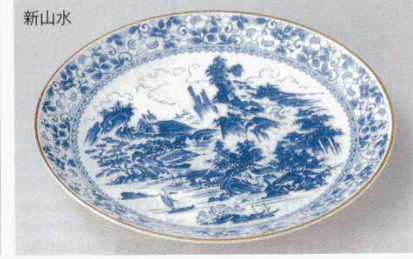
新山水 18432-654 10号丸皿(萬古焼) 1,350円 24入 (32×3cm) 18433-634 13号丸皿(萬古焼) 3,900円 10入 (42.5cm) 18434-634 12号丸皿(萬古焼) 2,300円 14入 (37cm)