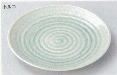
トルコ 18401-634 丸皿11号(萬古焼) 3,700円 15入 (33×3.5cm) 18402-634 丸皿10号(萬古焼) 2,400円 20入 (30×3.5cm)