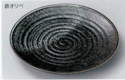
鉄オリーブ 18403-634 11号丸皿 3,700円 15入 (33×3.5cm) 18404-634 10号丸皿 2,400円 20入 (30×3.5cm)