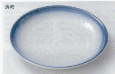
清流 18412-654 9号丸皿(萬古焼) 3,000円 20入 (28×4cm) 18413-654 8号丸皿(萬古焼) 2,100円 25入 (25×4cm)