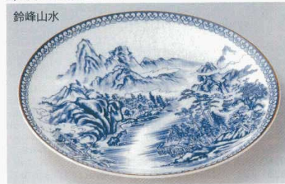
鈴峰山水 18418-644 13号丸皿(萬古焼) 3,900円 10入 (41×5cm) 18419-644 12号丸皿(萬古焼) 2,300円 14入 (38×4.5cm)