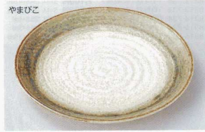
やまびこ 18408-634 11号丸皿(萬古焼) 3,700円 15入 (33cm) 18409-634 10号丸皿(萬古焼) 2,400円 20入 (30cm)