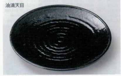
油滴天目 18410-644 11号丸皿(萬古焼) 3,700円 15入 (33.6×3.2cm) 18411-644 10号丸皿(萬古焼) 2,400円 20入 (30×3.2cm)