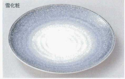
雪化粧 18405-634 11号丸皿(萬古焼) 3,700円 15入 (33cm) 18406-634 10号丸皿(萬古焼) 2,400円 20入 (30cm)