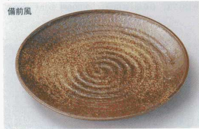
備前風 18407-644 10号丸皿(萬古焼) 2,400円 20入 (30×3.2cm)