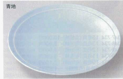
青地 18421-654 高台皿12号(萬古焼) 2,550円 10入 (37.5×5cm) 18422-654 高台皿11号(萬古焼) 2,300円 12入 (34.5×5cm)