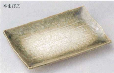
18519-634 12号長角皿(萬古焼) 3,700円 12入 (37.5×26.5×3.8cm) 18520-634 11号長角皿(萬古焼) 2,600円 16入 (34.5×23.5×3.7cm)