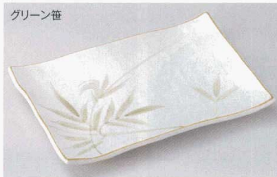
18530-644 10号長角皿(萬古焼) 2,100円 20入 (30.3×21×3.4cm) 18531-644 9号長角皿(萬古焼) 1,600円 30入 (28.5×18.5×3cm) 18532-644 11号長角皿(萬古焼) 2,400円 15入 (33.5×23.5×4cm)