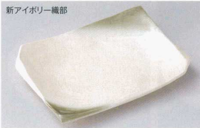
18504-634 12号長角皿(萬古焼) 2,500円 15入 (35×27×5cm)