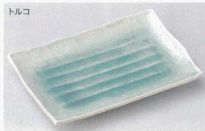
18511-634 12号長角皿(萬古焼) 3,700円 12入 (37.5×26×4cm) 18512-634 11号長角皿(萬古焼) 2,600円 16入 (34.5×23.5×4cm)