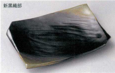
18501-634 12号長角皿(萬古焼) 2,500円 15入 (35×27×5cm)