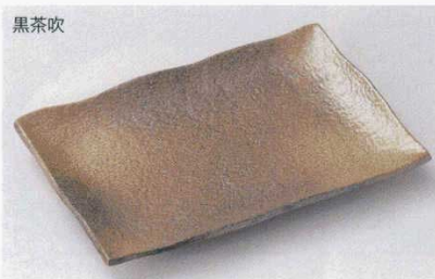
18507-654 12号長角皿(萬古焼) 3,300円 12入 (37×26.5×4cm) 18508-654 11号長角皿(萬古焼) 2,900円 15入 (34×23.5×4cm)