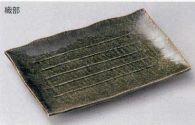
18528-644 12号長角皿(萬古焼) 3,700円 12入 (37.8×26.5×4cm) 18529-644 11号長角皿(萬古焼) 2,600円 16入 (34.5×23.5×4cm)