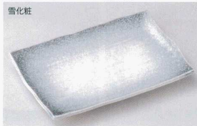
18521-634 10号長角皿(萬古焼) 2,100円 20入 (30.5×21×3.5cm) 18522-634 12号長角皿(萬古焼) 3,700円 12入 (37.5×26.5×3.8cm) 18523-634 11号長角皿(萬古焼) 2,600円 16入 (34.5×23.5×3.7cm)