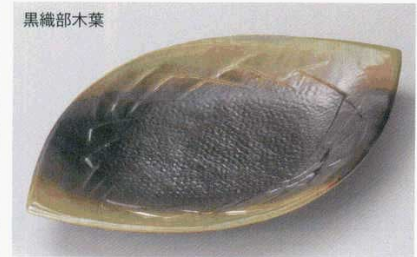
18503-634 13号皿(萬古焼) 2,500円 20入 (40.5×22.5×4cm)