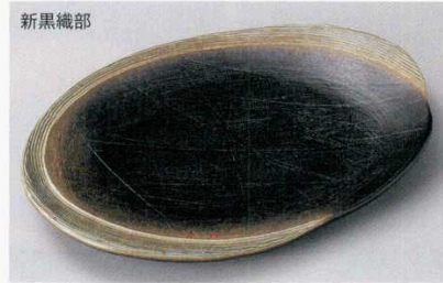
18502-634 12号小判皿(萬古焼) 2,500円 20入 (36×27×3.3cm)