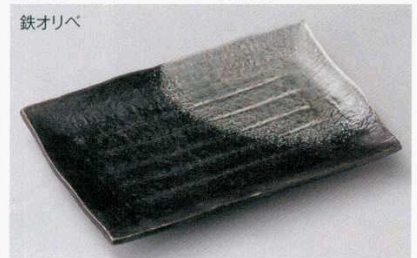
18524-634 10号長角皿(萬古焼) 2,100円 20入 (30.5×21×3.5cm) 18525-634 12号長角皿(萬古焼) 3,700円 12入 (37.5×26.5×3.8cm) 18526-634 11号長角皿(萬古焼) 2,600円 16入 (34.5×23.5×3.7cm) 18527-634 10号長角皿(萬古焼) 2,100円 20入 (30.5×21×3.5cm)