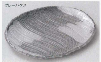
18533-654 10号小判皿(萬古焼) 2,400円 20入 (31.5×25.5×2.5cm)