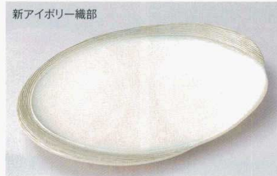
18505-634 12号小判皿(萬古焼) 2,500円 20入 (36×27×3.3cm)