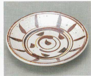
18620-254 手描錆絵玉7.0皿 2,180円 40入 (22.3×3.7cm)