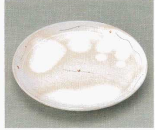
18608-554 粉引小花7.0皿 3,100円 30入 (22.5×3cm)