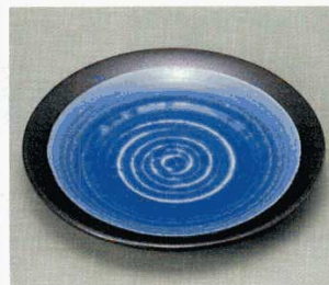
18618-144 鉄砂ゴス7.5皿 2,350円 30入 (23.3×3.3cm)