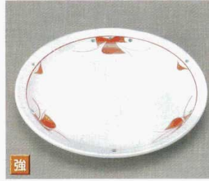
18607-544 赤紅小花7.0丸皿 3,500円 60入 (21×2.5cm)