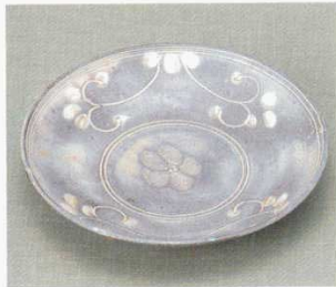
18601-664 黒刷毛目草花皿(信楽焼) 4,730円 (22×3.5cm)