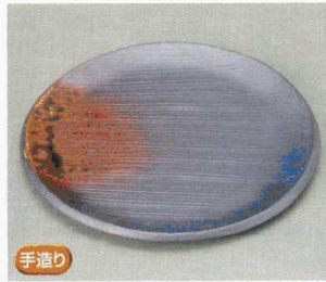
18610-314 手造いぶしクシ目丸7.0皿 2,800円 30入 (23.5×2cm)