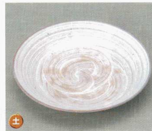
18619-304 竹目前菜皿 2,200円 30入 (20×3.5cm)