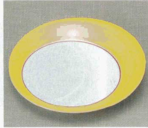
18603-164 黄巻朱線変形丸皿 3,800円 40入 (22.8×3.5cm)