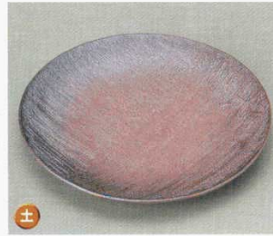
18611-144 備前くし目7.5皿 2,700円 30入 (23×3cm)