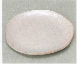
18604-664 灰袖マット7.0布目乱皿浅(信楽焼) 3,630円 (21×1.5cm)