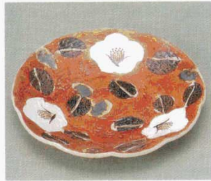
18605-524 赤濃山茶花7.0丸皿 3,450円 40入 (21.8×3.2cm)