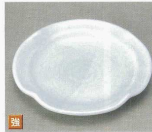
18615-144 青白磁四ツ押和皿(大) 2,600円 30入 (21×4.3cm)