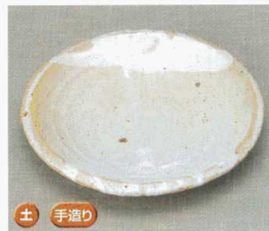
18613-304 黄唐津7寸タタキ皿 2,700円 40入 (20.7×3cm)