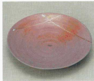
18609-314 黒泥一珍7寸皿 3,000円 40入 (22.8×22.8×3.3cm)