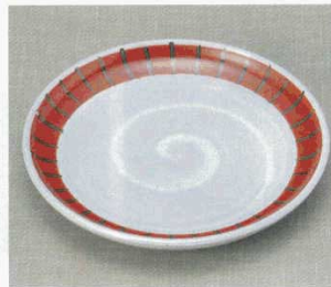
18614-254 赤巻刷毛目7寸皿 2,600円 40入 (22×3.3cm)