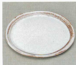
18617-664 鉄刷毛目7.0丸皿(信楽焼) 2,500円 (21.5×2cm)