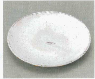
18612-334 粉引魚紋7.0皿 2,700円 40入 (21.7×3cm)