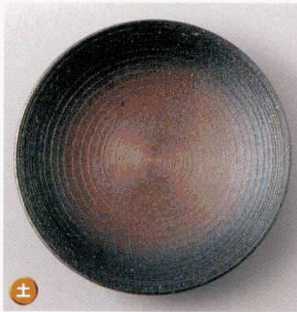
18901-144 新緑10.0皿 15,000円 10入 (31×3.5cm) 18902-144 新緑9.0皿 5,600円 15入 (26.5×2.5cm)