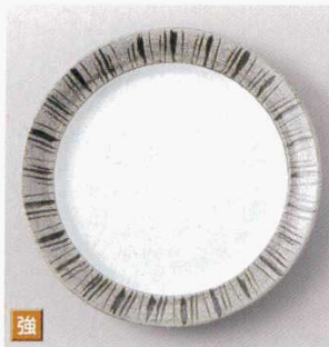
18903-174 焼締10.5皿 7,000円 15入 (32.7×5.2cm) 18904-174 焼締9.5皿 4,500円 20入 (29×5cm)