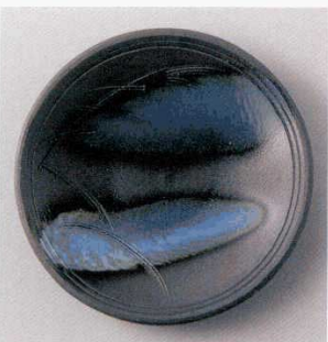
18934-314 雲海芦8.0丸皿 3,500円 20入 (25.4cm) 18935-314 雲海芦7.0天皿 2,800円 30入 (22.8×3cm) 18936-314 雲海芦6.0丸皿 1,850円 80入 (20.5cm)