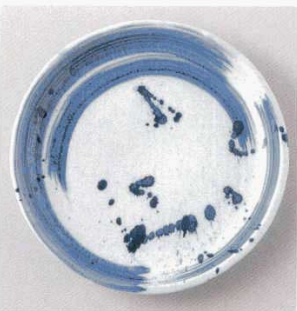
18919-134 筆遊び玉淵丸9.0皿(軽量磁器) 3,850円 (26×3.2cm) 18920-134 筆遊び玉淵丸8.0皿(軽量磁器) 2,650円 (23.3×3.1cm)