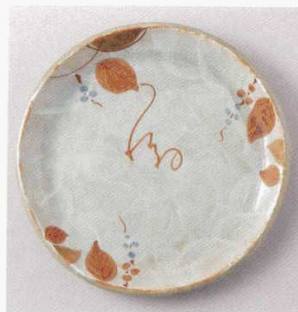
18907-544 赤絵木の葉9.0丸皿 4,800円 24入 (27×2.5cm) 18908-544 赤絵木の葉7.0丸皿 2,150円 36入 (20.6×2.4cm)