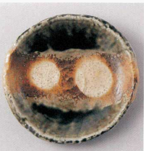
18931-314 嵯峨野8.5深皿 3,600円 (26×25.5×4cm) 18932-314 嵯峨野7.5深皿 2,150円 (23×22×3.5cm) 18933-314 嵯峨野6.5深皿 1,650円 (19.5×18.7×2.5cm)