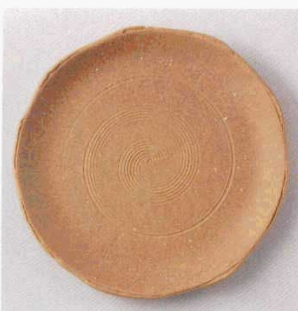
18923-664 火色8.0丸皿(信楽焼) 3,200円 (25×2.5cm) 18924-664 火色7.0丸皿(信楽焼) 2,400円 (21×2.5cm)