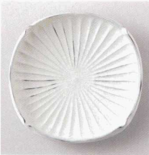
18909-174 なで型菊彫7.5寸皿 2,650円 20入 (23×4.8cm) 18910-174 なで型菊彫6寸皿 1,760円 40入 (18.3×4cm)