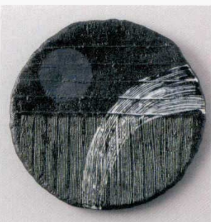
18921-134 炭化土白刷毛三ツ足9.0皿 2,900円 (26.5×26×2cm) 18922-134 炭化土白刷毛三ツ足7.0皿 2,150円 (21.8×21×2.5cm)