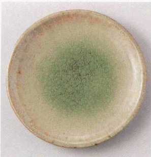
18911-664 ビードロ8.0丸皿(信楽焼) 2,700円 (24×3cm) 18912-664 ビードロ7.0丸皿(信楽焼) 2,150円 (21×2.5cm)