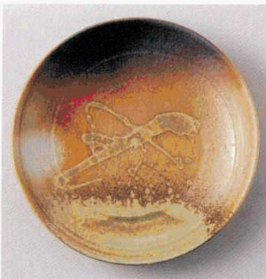
18913-664 古信楽8.0丸皿(信楽焼) 3,000円 (25×3.5cm) 18914-664 古信楽7.0丸皿(信楽焼) 2,530円 (21.8×3cm)