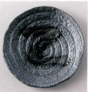
18928-314 南蛮ライン尺丸皿 5,720円 8入 (33×5.5cm) 18929-314 南蛮ライン9.0皿 4,180円 20入 (26.5×26.5×3.5cm) 18930-314 南蛮ライン7.0皿 2,200円 40入 (22×3.5cm)