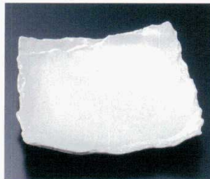
19707-174 白マット重ね8.5角皿 3,320円 15入 (25.6×25×5.5cm)