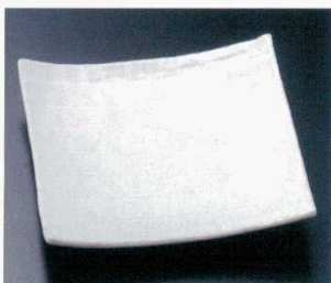
19720-234 ソギ目大皿 1,300円 (22×4.3cm)