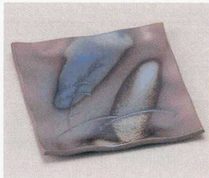
19706-314 雲海芦正角皿 3,450円 30入 (23.3×23.3×2cm)