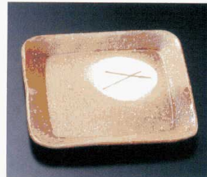
19704-664 焼火ダスキ8.0角皿(信楽焼) 4,000円 (24.5×24.5×3cm)