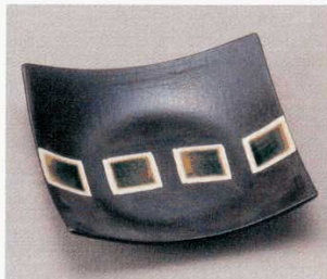
19711-564 黒織部モダン正角深皿(大) 2,900円 20入 (20.8×20.8×4.8cm)