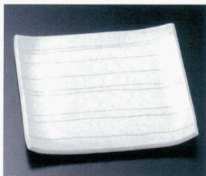
19716-294 カラーストライプ角皿(大) 2,200円 20入 (23×23×1.9cm)