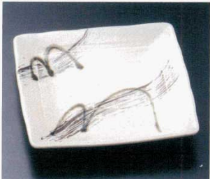
19709-334 黒黄金四角皿 3,250円 20入 (24×24×4cm)