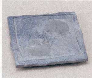
19702-664 黒窯変ボタモチ正角皿 4,500円 (22×22×2.8cm)