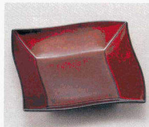
19708-274 ア×釉波型23cm深口皿 3,400円 30入 (23.1×23.1×4.9cm)