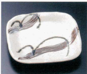
19715-334 黒黄金バスタ皿 2,250円 40入 (22.7×22.7×3cm)