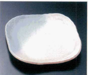
19717-524 さくら盛皿 2,150円 20入 (25×25×3.2cm)