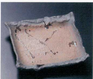
19719-144 焼締四角皿 2,050円 30入 (22×22×4cm)