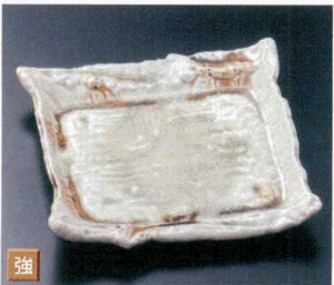
19713-144 ヒードロ四角皿 2,450円 30入 (22×21×4.2cm)