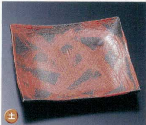
19710-144 根来正角8.0皿 3,150円 30入 (23×22.5×3.5cm)