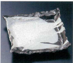
19714-174 カイラギ正角変型皿 2,400円 30入 (22×9.3cm)