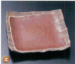
19705-164 漆風波瀾正角8.5寸盛皿 3,800円 20入 (24.5×24.5×3.7cm)