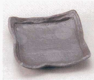
19703-254 炭化土正角皿 4,350円 30入 (23×23×5.5cm)