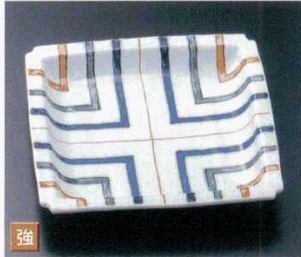
19701-144 カギ十草 4,800円 30入 (19×19×3cm)