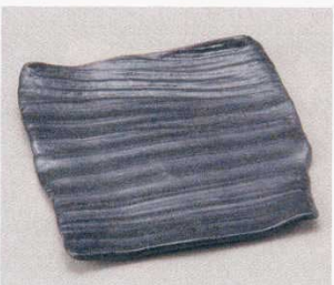
19718-654 黒いぶし8号角皿(萬古焼) 2,100円 20入 (24.5×24×2.5cm)