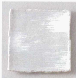
20309-474 白舂7.0正角皿 2,000円 30入 (22.5×22.5×2cm) 20310-474 白舂6.0正角皿 1,100円 40入 (18.5×18.5×2cm)