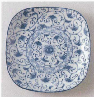
20339-124 藍彩四角7.5皿 820円 40入 (21×21×4cm) 20340-124 藍彩四角5.0皿 410円 100入 (15.2×15.2×3.2cm) 20341-124 藍彩四角3.5皿 310円 150入 (11.7×11.7×2.5cm)