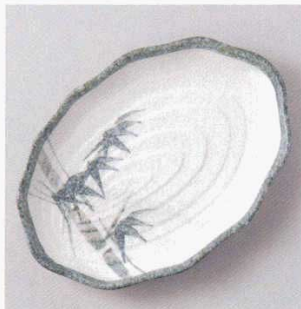
20322-114 グリン淡雪竹12吋ブラター 2,500円 30入 (31.5×22.5cm) 20323-114 グリン淡雪竹10吋ブラター 1,350円 40入 (26.8×18.7cm) 20324-114 グリン淡雪竹9吋ブラター 1,000円 50入 (23.7×17cm)