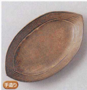
20328-054 ta.ta.la しなもんオーバルプレートL 3,700円 20入 (32×19.8×5cm) 20329-054 ta.ta.la しなもんオーバルプレートS 2,450円 40入 (25.5×15.2×3.5cm)