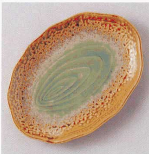
20335-034 イラボ小判皿(中) 1,000円 (24×17×2.5cm) 20336-034 イラボ小判皿(小) 850円 (21.5×15.5×2.2cm)