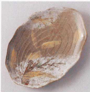
20332-104 備前桜木目小判皿(大) 4,400円 25入 (31.5×22.5×3.5cm) 20333-104 備前桜木目小判皿(中) 3,000円 30入 (26.3×18.3×3cm) 20334-104 備前桜木目小判皿(小) 2,550円 30入 (23.8×17×2.5cm)