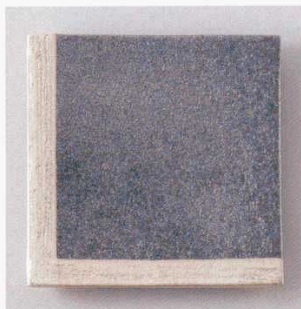
20301-664 黒窯変角白掛け分け7.3足付角皿(信楽焼) 5,500円 22×22×3cm 20302-664 黒窯変角白掛け分け6.6足付角皿 3,850円 (20×20×3.3cm)