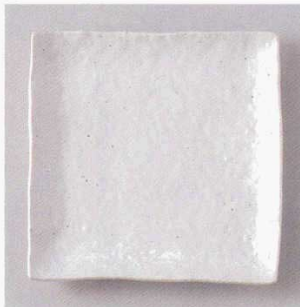
20314-174 新粉引90正角皿 3,000円 20入 (27.5×4.5cm) 20315-174 新粉引70正角皿 1,300円 30入 (22×3.7cm) 20316-174 新粉引60正角皿 800円 40入 (17.5×3.7cm)