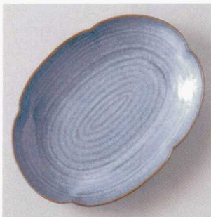
20337-444 青うのふ雲型盛皿 1,450円 40入 (25.5×19×4cm) 20338-444 青うのふ雲型多用皿 730円 45入 (20×12.7×2.5cm)