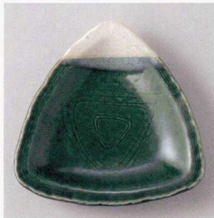
20317-024 織部三角皿(大) 1,750円 30入 (26×5cm) 20318-024 織部三角皿(中) 1,100円 40入 (23×3.6cm) 20319-024 織部三角皿(小) 530円 100入 (15×3cm)