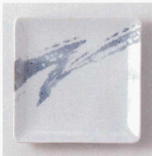
20303-274 薄墨雲8.0正角皿 3,350円 40入 (24.7×24.7cm) 20304-274 薄墨雲7.0正角皿 2,200円 60入 (20.7×20.7cm) 20305-274 薄墨雲5.0正角皿 1,450円 80入 (16.4×16.4cm)