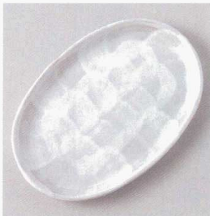
20325-564 乳白志野小判10号皿 2,700円 20入 (30.2×22.3×2.5cm) 20326-564 乳白志野小判9号皿 1,380円 30入 (26×18×2cm) 20327-564 乳白志野小判7号皿 1,000円 50入 (22.5×15.2×1.8cm)