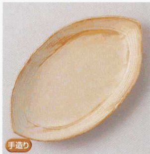
20330-054 ta.ta.la みらくオーバルプレートL 3,700円 20入 (32×19.8×5cm) 20331-054 ta.ta.la みらくオーバルプレートS 2,450円 40入 (25.5×15.2×3.5cm)