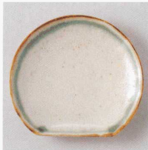
20320-334 わざび半月プレート(中) 1,960円 40入 (24.2×22.2×3.7cm) 20321-334 わざび半月プレート(小) 1,050円 50入 (19×17.4×3cm)