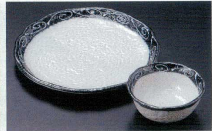
20629-554 呉須ライン唐草丸7.0皿 1,500円 40入 (21×2.5cm) 20630-554 呉須ライン唐草香水 720円 100入 (11.2×4.5cm)