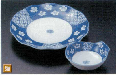
20601-524 青白磁菊型天皿 3,150円 40入 (20×3.2cm) 20602-524 青白磁菊型香水 1,050円 120入 (11.3×3.7cm)