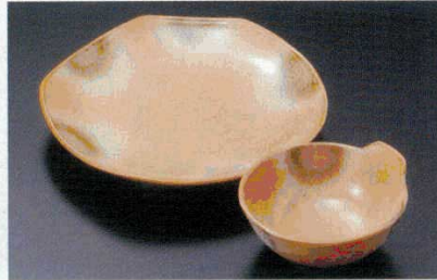
20615-284 志野織部吹7.0天皿 2,000円 40入 (21.5×3.5cm) 20616-284 志野織部吹香水 560円 120入 (12.5×11.8×5.7cm)