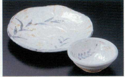
20611-554 志野タタキ芦天皿 2,400円 30入 (22.5×3.5cm) 20612-554 志野タタキ芦香水 830円 80入 (12.7×4.3cm)