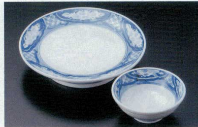
20621-184 一珍ふれあい丸天皿 1,950円 30入 (21.3×2.7cm) 20622-184 一珍ふれあい丸香水 1,100円 100入 (11.6×4.8cm)