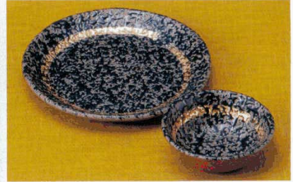
20617-554 紺結晶金剛目毛7.0天皿 2,000円 40入 (19.5×2.3cm) 20618-554 紺結晶金剛目毛香水 1,350円 80入 (11.2×3.5cm)