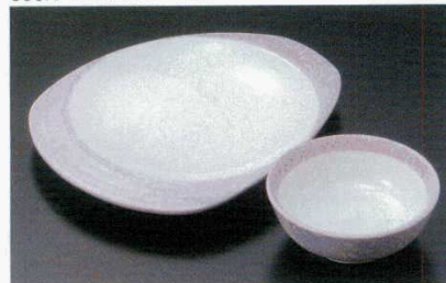
20619-144 雪化粧白吹変形皿 1,950円 30入 (22.5×18×2.7cm) 20620-144 雪化粧白吹小鉢(香水) 1,250円 80入 (11.3×4.5cm)