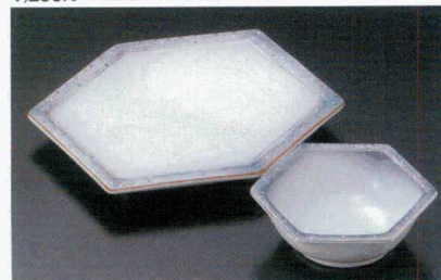
20625-554 武蔵野天皿 1,750円 40入 (19.5×19×2.3cm) 20626-554 武蔵野香水 1,100円 120入 (11×3.7cm)