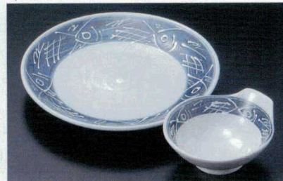
20627-184 一珍うず潮丸7.0皿 1,600円 30入 (21.3×2.7cm) 20628-184 一珍うず潮香水 780円 100入 (12.5×11.7×4.4cm)