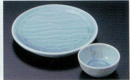
20623-174 深海青地波彫6.3天皿 1,700円 50入 (19×2.3cm) 20624-174 深海青地丸香水 660円 120入 (9×3.9cm)