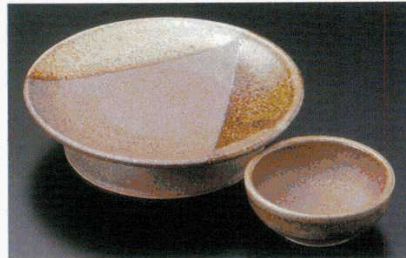
20613-264 信楽トライアングル天皿 2,200円 30入 (21.7×6.3cm) 20614-264 信楽香水 550円 120入 (11.3×4.3cm)