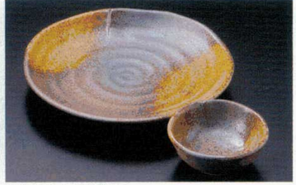
20605-104 備前風天皿 2,800円 20入 (25×4.5cm) 20606-104 備前風香水 1,300円 80入 (11.2×5cm)