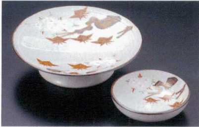
20707-304 雲錦高台天皿 2,450円 30入 (17.8×5cm) 20708-304 雲錦玉割香水 1,250円 100入 (10.5×3cm)