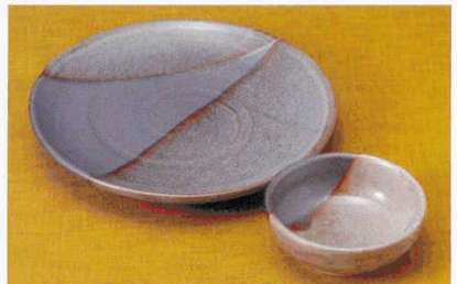
20729-264 ネズミ志野丸7.0皿 1,300円 40入 (22×3cm) 20730-264 ネズミ志野玉割 450円 100入 (11.4×4.2cm)