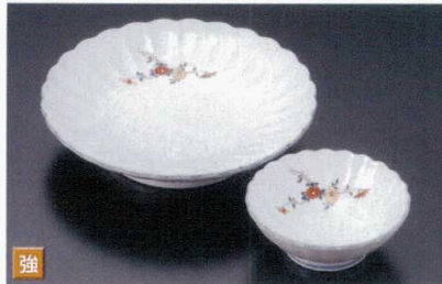
強 20715-264 柿右衛門写菊菊型天皿 2,100円 40入 (21×4.5cm) 20716-264 柿右衛門写菊菊型香水 1,000円 120入 (12.2×4.6cm)