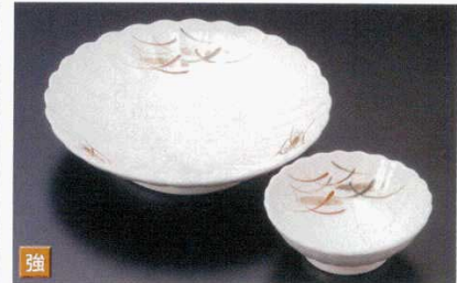
強 20705-114 武蔵野菊形天皿 2,500円 30入 (21×4.5cm) 20706-114 武蔵野菊形香水 1,230円 100入 (12.2×4.6cm)