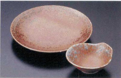
20719-274 織部吹天皿 1,850円 60入 (23.3×3cm) 20720-274 織部吹香水 850円 80入 (12.7×12.1×4.5cm)