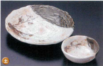
± 20713-174 オリベ古木半月天皿 2,200円 40入 (22.5×20.8×4cm) 20714-174 オリベ古木香水 1,050円 100入 (11.3×4.2cm)