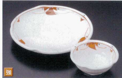
強 20703-544 赤紅小花天皿 3,000円 30入 (21×3cm) 20704-544 赤紅小花香水 1,800円 80入 (11.5×4.5cm)