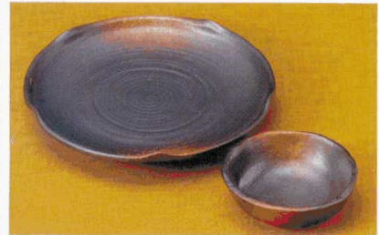
20711-454 梅型焼げ天皿 2,300円 50入 (20.7×4.2cm) 20712-454 焼げ丸香水 890円 80入 (11.2×3.5cm)