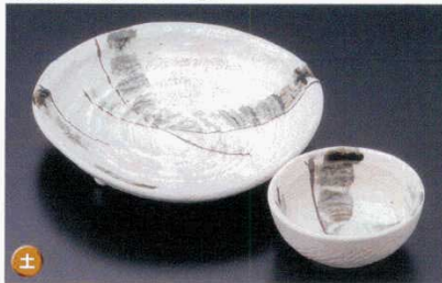
± 20721-234 岩肌刷毛目天皿 1,850円 (22×4.5cm) 20722-234 岩肌刷毛目香水 560円 (11×4.5cm)