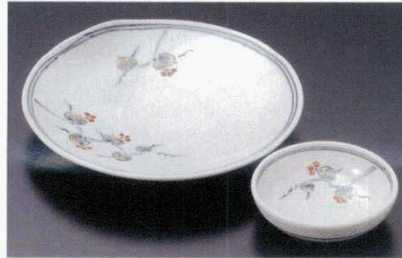
20709-494 手描きつる草天皿 2,200円 (21.3×3.5cm) 20710-494 手描きつる草香水 1,300円 (10.3×2.8cm)