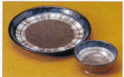
20723-284 測紺巻7寸天皿 1,800円 60入 (22×3cm) 20724-284 測紺巻香水 680円 100入 (11.5×4.5cm)