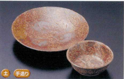
± 手造り 20725-104 茶備前天皿 1,650円 40入 (20.5×3.6cm) 20726-104 茶備前香水 1,100円 80入 (11.8×11.3×4.7cm)