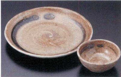
20701-284 点一引天皿 2,600円 30入 (24.5×3cm) 20702-284 点一引香水 700円 100入 (11.5×4.5cm)