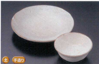
± 手造り 20727-104 粉引天皿 1,650円 40入 (20.5×3.6cm) 20728-104 粉引香水 1,100円 80入 (11.8×11.3×4.7cm)