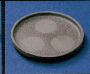
21220-174 炭化土7.5切立丸皿 2,950円 20入 (22.4×2.7cm)