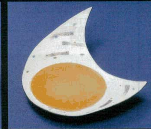
21215-144 つばさ型オレンジ吹皿 4,000円 20入 (32.8×26×6.5cm)