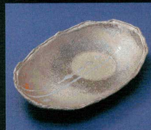
21213-664 炭化ポタモチ9.6楕円皿 (信楽焼) 4,180円 (29×20×5cm)