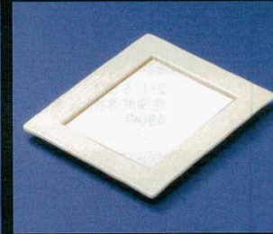
21211-204 黄銀巻縁付角皿 4,300円 16入 (26.8×22.3×1.8cm)