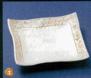
21208-054 ta.ta.la しなもんリムボウルM 4,900円 40入 (26.5×6.2cm)