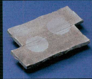
21202-664 炭化ハツ橋 (信楽焼) 7,100円 (24×16×2.5cm)