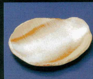
21217-574 春結晶変形9.0皿 3,700円 (27.7×24.5×3cm)