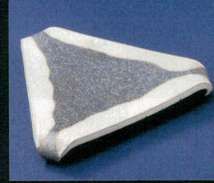
21207-664 黒窯変掛け分け7.0三角高台皿 (信楽焼) 4,950円 (23×20×4cm)