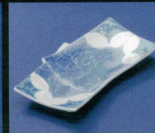
21219-144 ラスター濃花重ね皿 3,300円 40入 (30.5×16×4.5cm)