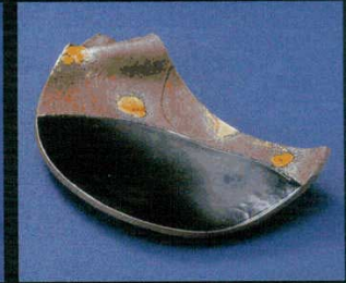
21216-144 金箔ひさご形皿 4,000円 20入 (29×16.5×5cm)