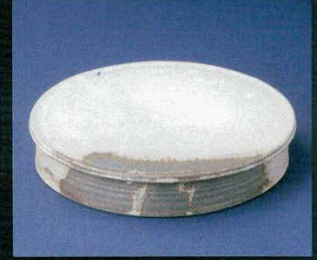
21204-664 灰釉粉引8.5台皿 (信楽焼) 6,160円 (26×5cm)