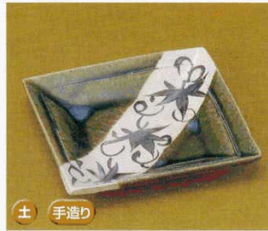
土 手造り 21502-104 織部紅葉正角皿 2,600円 30入 (18.7×3cm)