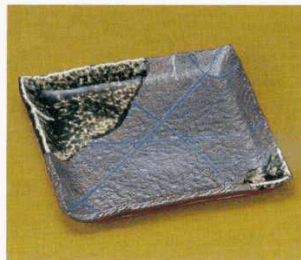
21506-524 南蛮乱十草8.0正角皿 2,600円 20入 (21.5×21.5×2.5cm)