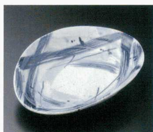
21520-174 呉須格子たわみ9寸皿 2,100円 30入 (26.8×20×5.3cm)