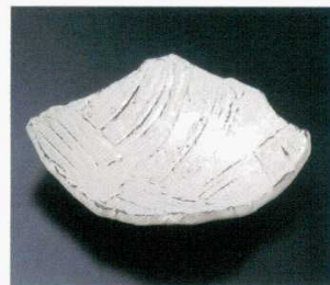
21508-174 粉引拭取り変形6.5皿 2,250円 30入 (19.5×19.5×4.7cm)