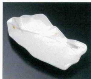
21512-174 ヒワ吹金箔ラスター口変り尺皿 2,440円 15入 (31.6×15×3.6cm)