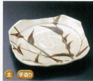
土 手造り 21503-104 御本手芦角皿 2,600円 25入 (20×4cm)