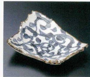
21504-294 たご唐草変型長皿(小) 2,600円 40入 (23.5×9×5cm)