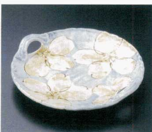
21513-174 彩り花耳付8.5皿 2,880円 20入 (25.5×24.4×4cm)