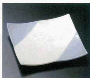
21516-164 あい志野浜付四角皿(大) 2,350円 15入 (24.7×24.7×3.6cm)