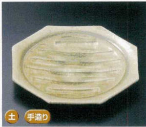
土 手造り 21501-104 灰釉八角盛皿 2,600円 30入 (21.5×3.7cm)