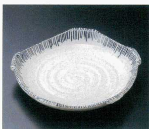
21514-574 十草五角前菜皿 2,600円 (23.7×3.6cm)