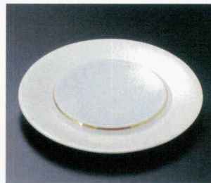
21507-204 黄銀巻見込上り丸皿 2,650円 20入 (22.8×2.4cm)