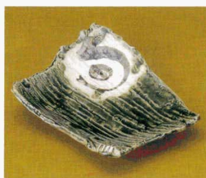
21515-184 織部匂味8.0皿 2,600円 20入 (24×20×5cm)