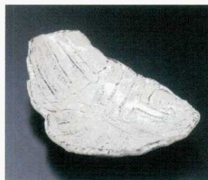
21511-174 粉引拭取り変形9.0皿 2,300円 20入 (27×16.5×5cm)