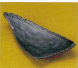
21517-114 炭化土いぶし陶片9.0皿 2,500円 (32.3×16×6.7cm)