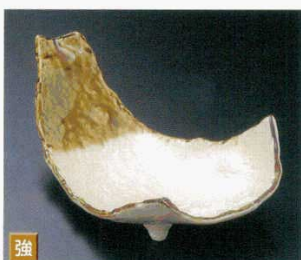
強 21518-114 強化アメ軸変形三足扇前菜皿 2,550円 (15×4×8.5cm)