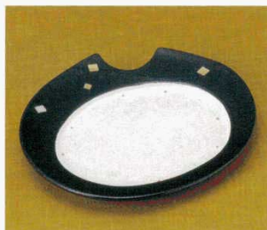
21510-244 ラスターゆず黒変形皿 2,400円 40入 (23.1×18.2×2.8cm)