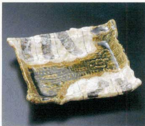
21505-114 織部十草ソギ正角変形皿 2,500円 (22.5×4.3cm)