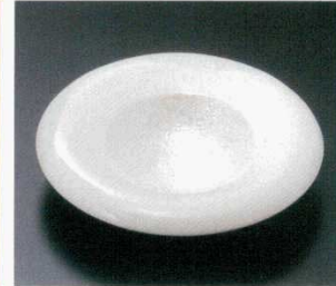
21704-164 パールスター21cm反鉢 1,900円 60入 (20.5×4cm)