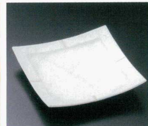
21720-234 千段(大)茶角皿 1,750円 (21×4cm)