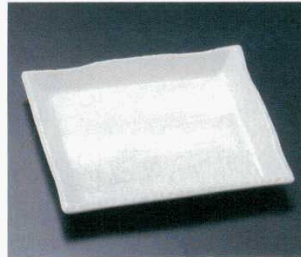
21706-454 白化粧ソギ四方皿 1,600円 30入 (21×2cm)