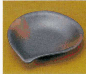
21707-454 黒伊賀吹変型片口大皿 1,400円 40入 (22.2×20×4cm)