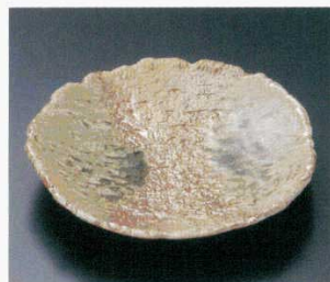
21718-294 織部砂目7寸皿 1,750円 30入 (21.9×3.6cm)