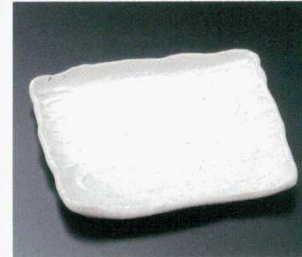
21712-574 荒ソギ白正角皿 1,500円 (22×2cm)