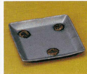
21716-474 南蛮吹正角皿 1,300円 30入 (19.5×19.5×2cm)