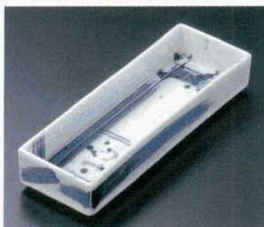
21717-164 呉須格子長角8寸鉢 1,750円 24入 (24×8×4.2cm)