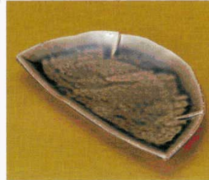
21703-034 伊賀オリベ半月皿 1,980円 (27×17×3cm)