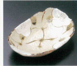
21708-574 山茶花楕円鉢 1,800円 (22×15.1×4.8cm)