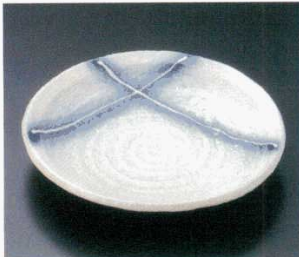
21701-524 一珍青吹格子7.0丸皿 2,000円 40入 (21.8×4cm)