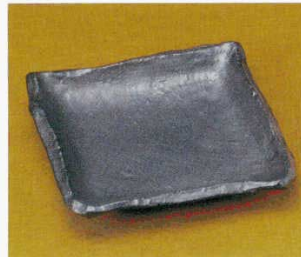
21710-134 匠(黒)正角皿(大) 1,780円 20入 (23×23×4.5cm)