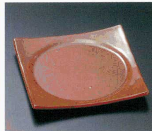
21715-184 鉄砂正角盛皿 1,650円 20入 (20.8×20.8×2.3cm)