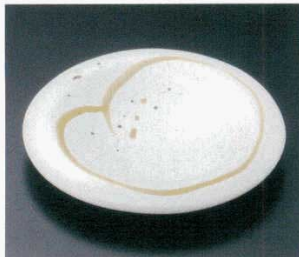
21709-174 白マット二色流し7寸丸皿 1,900円 30入 (21×3.3cm)