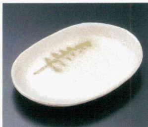
21713-554 ビードロ流し9.0楕円皿 1,500円 30入 (27×19.8×3.3cm)