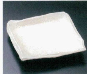
21711-134 匠(白)正角皿(大) 1,780円 20入 (23×23×4.5cm)