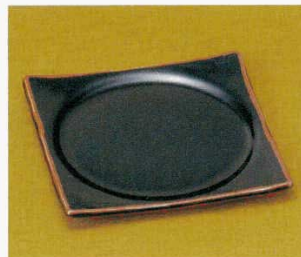
21714-184 ゆず天目正角盛皿 1,650円 20入 (20.8×20.8×2.3cm)