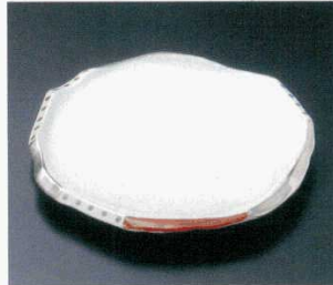
21702-134 色絵銀彩舞丸6.5寸皿 2,000円 (20.5×2cm)