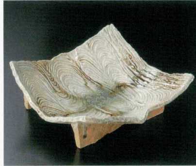
02205-574 ビードロ流水足付盛皿 4,000円 (24.5×9cm)