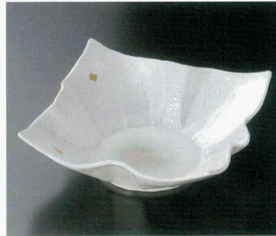
02211-304 ラスター彩ヒワ吹紙鍋型8寸鉢 4,250円 30入 (25.5×25.5×8cm) 02212-304 ラスター彩ヒワ吹紙鍋型7.0鉢 2,950円 40入 (20.8×20.8×7cm)