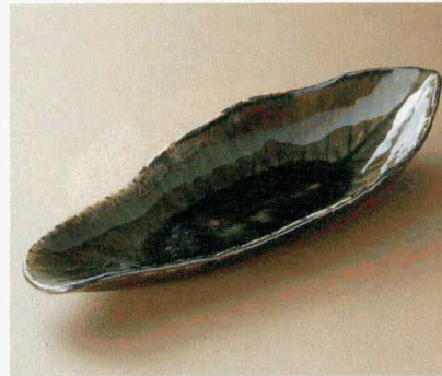
02208-134 いぶし織部朴葉大鉢 3,300円 (42.3×17.5×7cm)