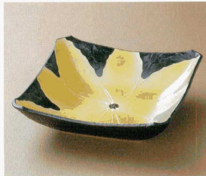
02210-574 一珍夢花角盛鉢(手描き) 4,400円 10入 (24×7cm)