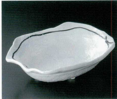
02204-314 黒結び石目大盛鉢 3,600円 (29×20×6cm)