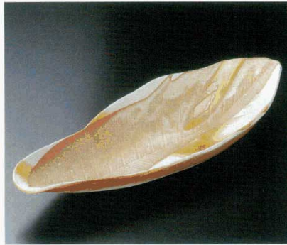
02202-134 緋ダスキ流し朴葉大鉢 3,300円 (42.3×17.5×7cm)