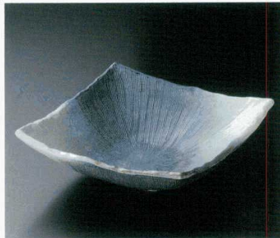
02207-644 青軸8号正角鉢(萬古焼) 2,900円 20入 (24×24×8cm)