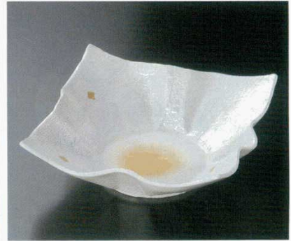
02213-114 ラスターイエロー吹紙鍋型8寸鍋 4,250円 20入 (25.8×7.7cm) 02214-114 ラスターイエロー吹紙鍋型7.0鉢 2,950円 30入 (21.5×7.5cm)