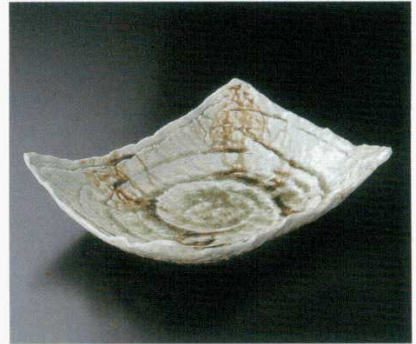
02209-174 ビードロガタ彫長角四方上り盛皿 3,600円 10入 (30.8×23.5×8cm)