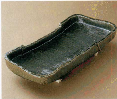
02201-144 織部切立尺二寸盛鉢 9,400円 10入 (38.5×17.5×7.5cm)