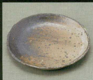
22017-664 灰みかけ7.0丸皿(信楽焼) 3,300円 (21×3cm)