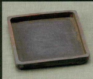
22009-664 炭化6.0角皿(信楽焼) 4,280円 (18×18×2.5cm)