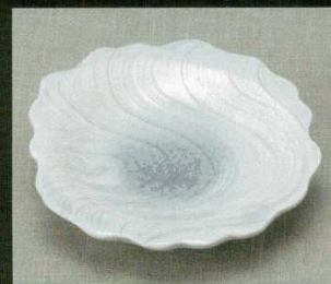
22018-034 灰青磁不定型流水皿 3,200円 (18×17×3.5cm)