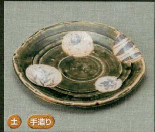
22003-034 灰青磁不定形前菜皿(手造り) 4,950円 (22.5×20×4cm)