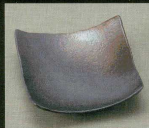
22019-664 黒窯変角皿(信楽焼) 3,150円 (17×17×6cm)