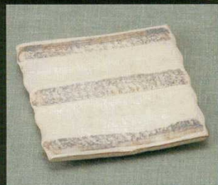
22020-664 粉引流5.7足付角皿(信楽焼) 3,080円 (17×16×1.7cm)