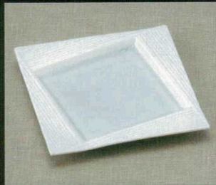
22005-294 スクエアープレート19cm青白磁 4,800円 40入 (19×19×2.2cm)