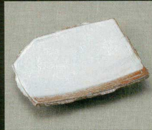
22002-664 粉引角切変形皿足付(信楽焼) 5,650円 (17×14×4cm)