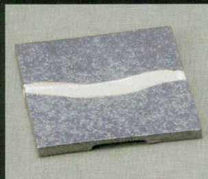
22013-664 黒窯変一文字6.3角皿(信楽焼) 3,520円 (19×19×1.5cm)