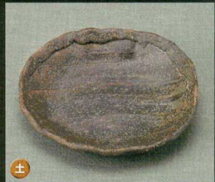
22011-444 手造織部つる草巻皿大 3,850円 30入 (12.5×2.2cm)