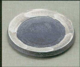
22008-664 黒窯変刷毛目6.6丸皿(信楽焼) 4,400円 (20×3cm)