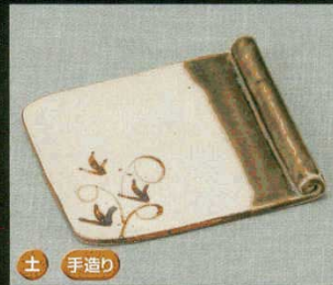
22010-034 伊賀焼締山型小付(手造り) 4,200円 (19×16.5×3.2cm)