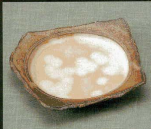
22001-664 粉引五角変形皿(信楽焼) 5,720円 (17.5×15.5×3.5cm)