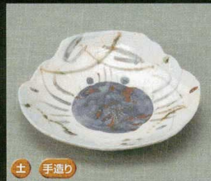
22014-174 織部丸削り前菜皿 3,500円 30入 (20.7×20×2cm)