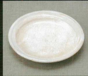
22006-664 粉引6.0丸皿(信楽焼) 4,800円 (18.5×3cm)